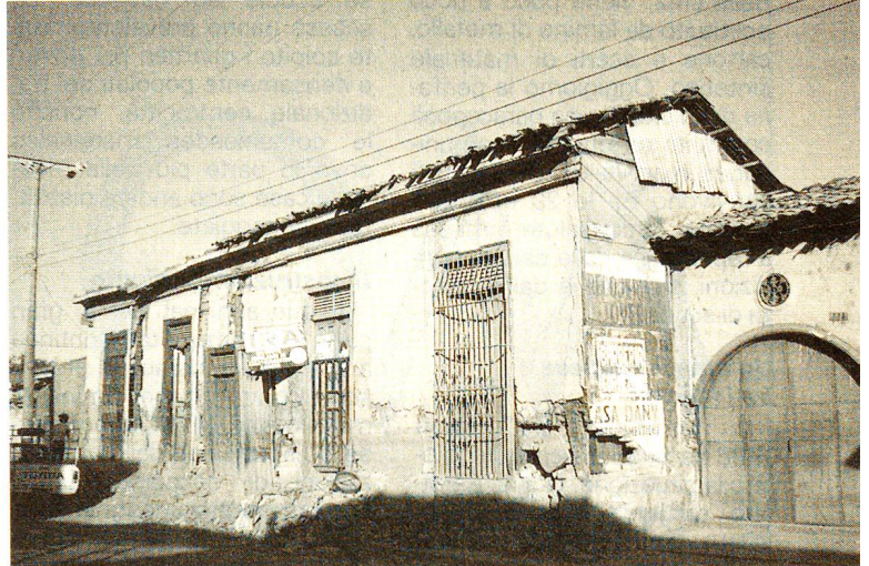
«Meson» nella parte vecchia della capitale. Un tempo case signorili, oggi le «mesones» abitate da decine di persone.

Nella situazione sociale e politica è anche radicato il conflitto fra esercito ed opposizione armata del Fronte di liberazione nazionale Farabundo Martí che in questi ultimi anni ha causato oltre 60 000 morti, perlopiù fra la popolazione civile. Le organizzazioni per la difesa dei diritti dell'uomo accusano all'unanimità soprattutto le forze di sicurezza dell'alto numero di vittime. La guerra fra esercito e guerriglia si svolge