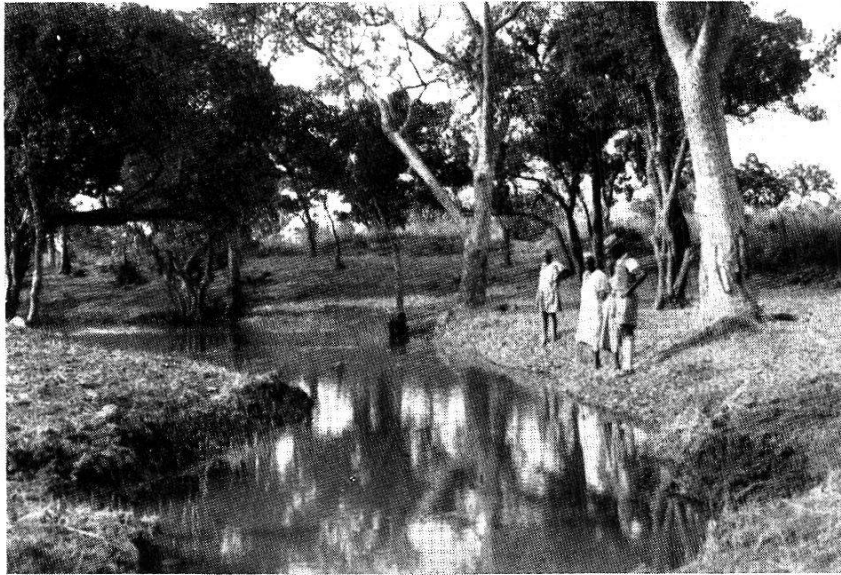
Fig. 107. Le marigot (fig. 104) après les travaux de prophylaxie agronomique.