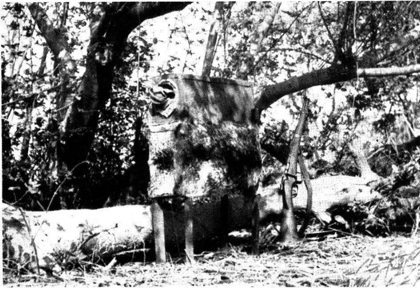
Fig. 100. Piège Morris installé dans le talweg desséché d'un affluent de la Volta Noire (Haute Côte-d'Ivoire).