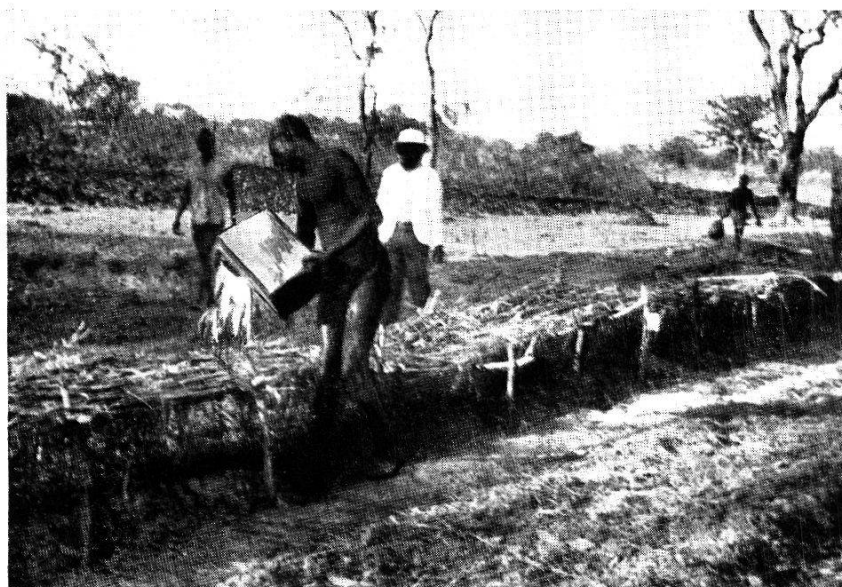
Fig. 109. Installation de cultures sur des terrains aménagés où les Tsétsés pullulaient avant les travaux de prophylaxie agronomique.