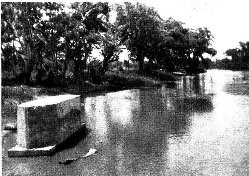
Fig. 103. Eclaircissement des rives d'une rivière aux abords d'un chantier du chemin de fer de Bobo-Dioulasso à Ouagadougou.