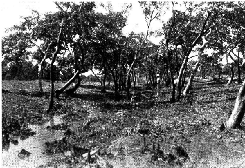
Fig. 108. Le marigot (fig. 105) après les travaux de prophylaxie agronomique.