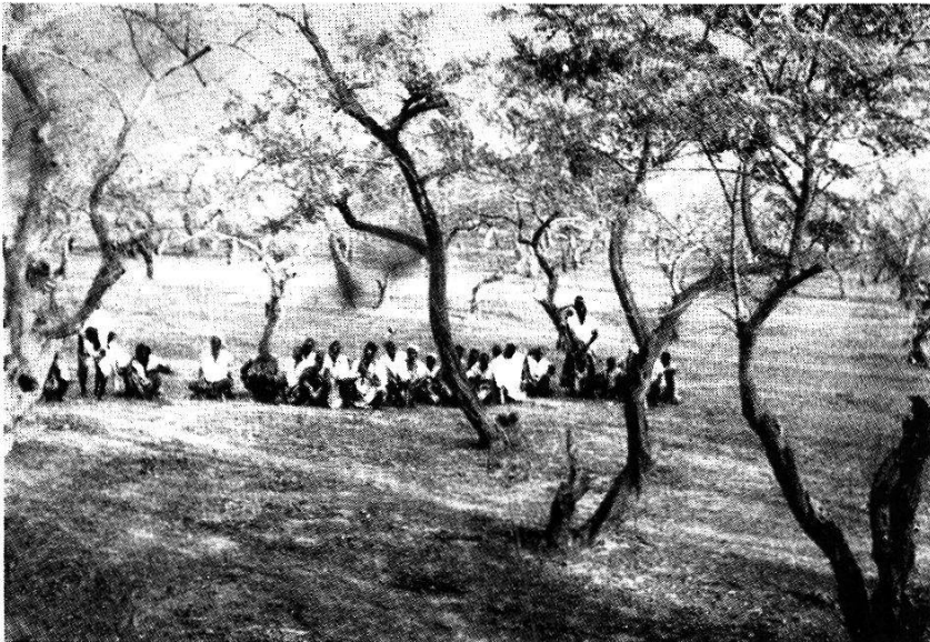
Fig. 102. Aménagement parfait d'un « Bois sacré » qui avant les travaux était un fouillis de lianes et de buissons où pullulaient les Tsétsés. (Sambo près de Yako, Hte Côte-d'Yvoire.)