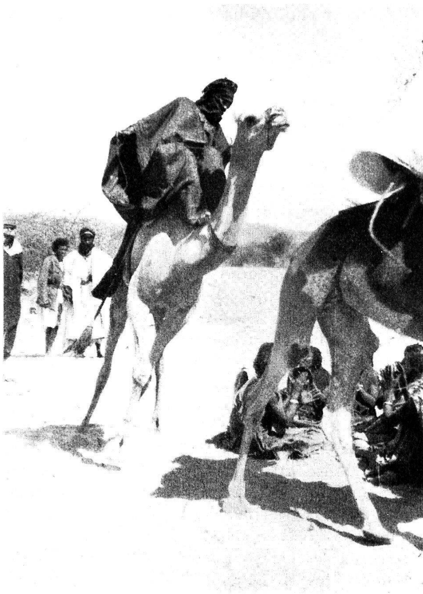
Photogr. 13. Carrousel de chameaux des nobles tinguerriguifs.

d'un numéro. L'inconvénient du système des étiquettes est que, malgré tous nos soins, elles tombent ou se déchirent facilement. Certains objets pourraient devenir difficiles à identifier.