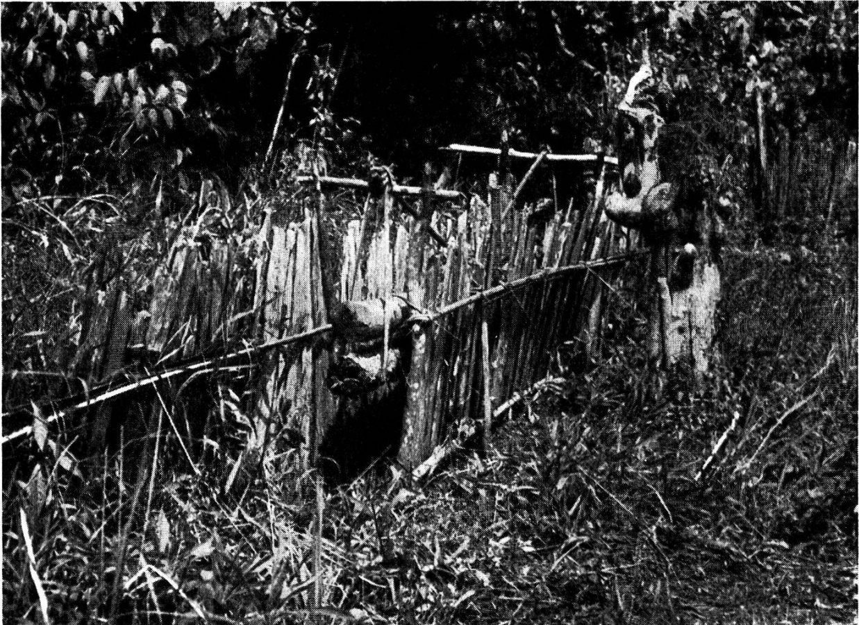
Abb. 6. Falle für Borstenferkel in der Umzäunung einer Reisplantage. Yapo 1952.