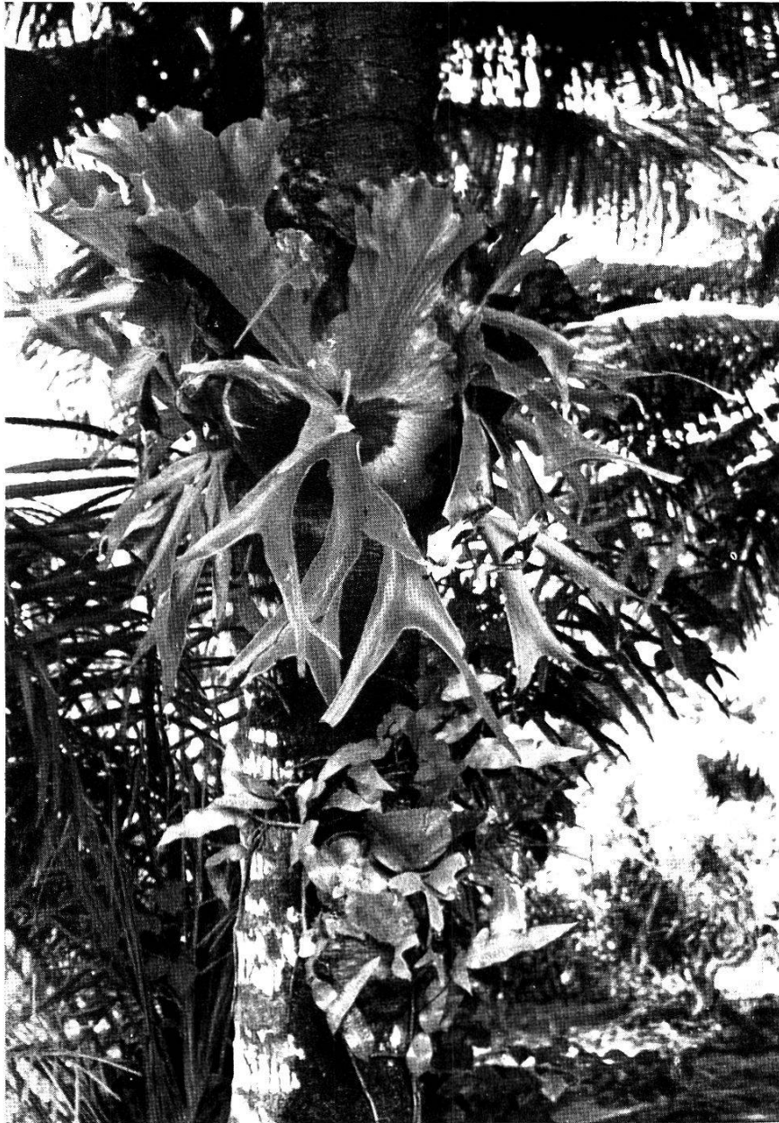
Fig. 10. Fougère épiphyte : Stenochlaena guineensis .

(de la famille des Pelomedusidés) ; la partie antérieure du plastron est mobile. Cette tortue cache ses œufs dans la terre le long de l'eau. Au même endroit vit Trionyx triunguis , animal carnivore qui ne possède pas de plaques épidermiques.