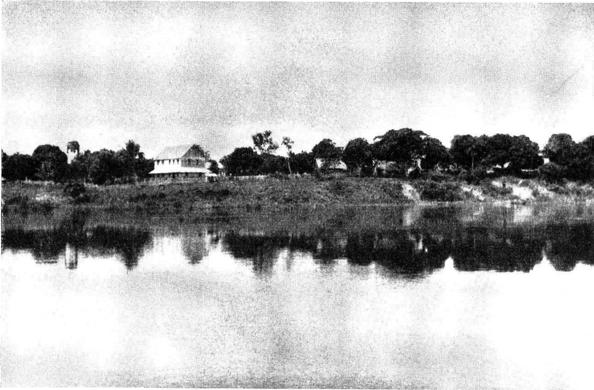
Abb. 2. Die Missionsstation São Francisco do Cururú am Ufer des Rio Cururú. Links ist das eine der beiden großen Häuser sichtbar, das Wohnhaus der Patres und Internat der größeren Jungen. Rechts hinter den Manga-Bäumen einige der Hütten des «Dorfes».