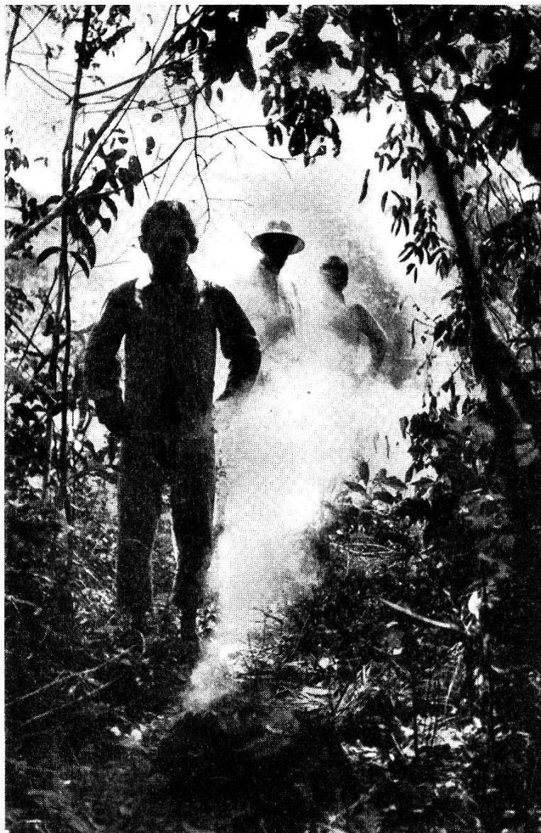
Abb. 5. An einer engen Stelle des Weges von der Siedlung der Alten Mission zu dem Tapirí-Lager verbrannte ein Indianer ein Nest der Atú-Bienen, um durch den beißenden Rauch dem «Kauschí», dem bösen Krankheitsgeist, den Durchgang zu versperren.

Fällen bis über eine Woche nach Beginn des Fiebers. 2—3 Tage nach seinem Auftreten trocknete der Ausschlag ab, ohne Narben zu hinterlassen. Dann aber traten die eigentlichen schweren Komplikationen der Krankheit auf, die sich vor allem in Affektionen der Schleimhäute äußerten. Eine Reihe von Patienten hatte die eigentlichen Masern bereits gut überstanden, danach erst erkrankten die betreffenden Personen in wirklich schwerer Weise. Mehrere solche Fälle führten zum Tode. Zuweilen aber stellten sich die schweren Komplikationen auch bereits in den ersten Tagen der Masernerkrankung ein.