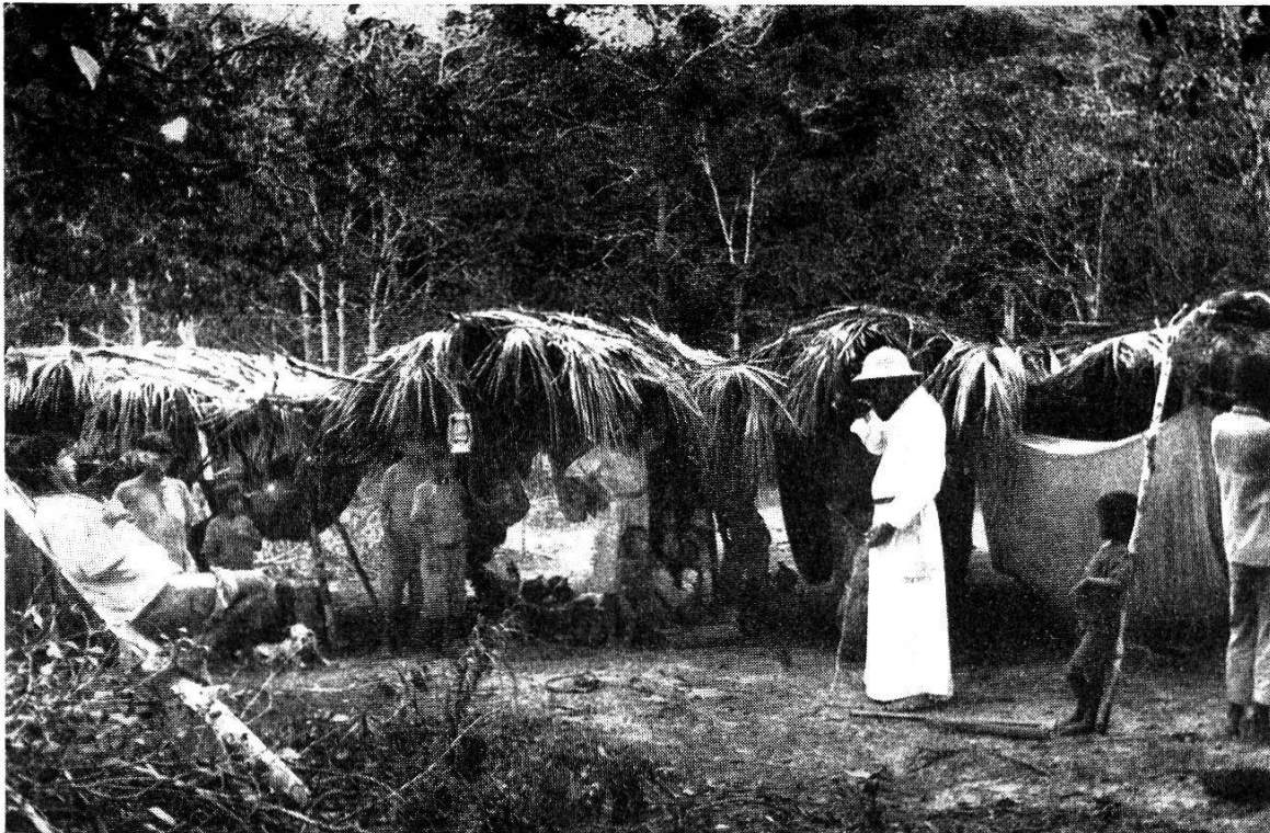
Abb. 4. Das Tapirí-Lager der Mundurukú-Indianer, die vor den Masern aus der Siedlung der Alten Mission geflüchtet waren.

großer Teil der noch gesunden Bewohner einige Kilometer weit auf die Campos geflüchtet, wo die Leute sog. Tapirís, aus Palmblättern und Ästen rasch errichtete, provisorische Schutzdächer, aufgeschlagen hatten und dort so lange abwarten wollten, bis die Krankheit in ihrer Siedlung erloschen sei (s. Abb. 4). An einer engen Stelle des Weges von der Siedlung zu dem Tapirí-Lager verbrannte bei unserem Besuch gerade ein Mann Nester der Atú-Biene; der beißende Rauch sollte dem «Kauschí», dem bösen Krankheitsgeist, den Durchgang versperren (s. Abb. 5).