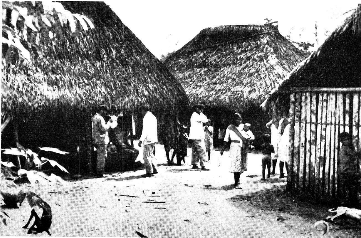
Abb. 3. Die Siedlung der Alten Mission am Rio Cururú.