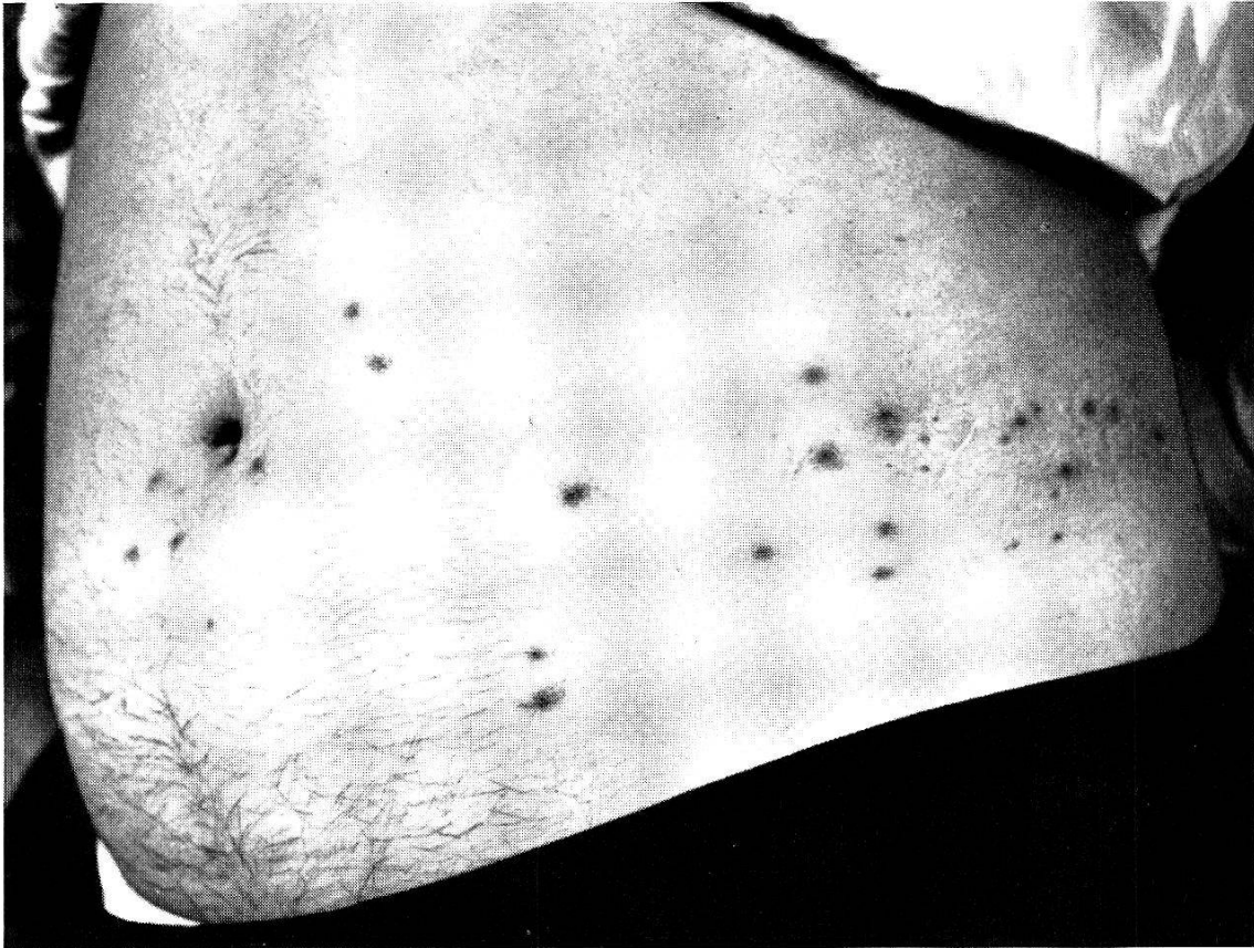
Abb. 2. Durch T. autumnalis -Larven verursachte Quaddeln in der Gürtelgegend.

weist Chlorbenzilat durch seine Selektivität und seine geringe Human-Toxizität so wichtige zusätzliche Eigenschaften auf, daß sich eine Empfehlung seines Einsatzes in praktischen Bekämpfungsaktionen nicht nur gegen T. autumnalis , sondern auch gegen die verschiedenen angeführten überseeischen Trombiculiden rechtfertigt.