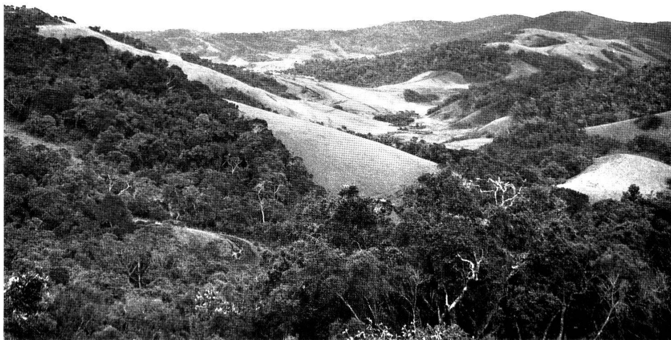
Fig. 2. Bassin de la Haute Kahololo (2750-2950 m).

Il se trouve à l'altitude de 2.700 m. au Sud du marais Kilungutwe dont il est séparé par un faible repli transversal.