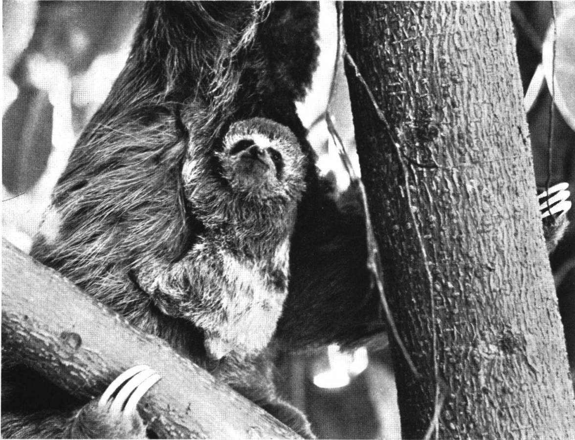
Abb. 4. Männchen von B. infuscatus flaccidus , 15 Tage alt, am Bauch der Mutter festgekrallt. Die Gesichtspigmentierung unterscheidet sich nun nicht mehr vom ausgewachsenen Tier. Dagegen ist die Hellfleckung der Rückenpartie auffällig von der dunkleren Färbung des Adultfells abgesetzt.

sen ausdehnt. Alle Faultiere schlafen nun jeweils des Nachts zu einem Knäuel verschlungen. Auch tagsüber ruht die Mutter oft mit den beiden Jungen oder mit dem Männchen im Schoß. Auf diese Weise hat Juv II Gelegenheit, von der Mutter zum Männchen oder zu Juv I hinüberzuklettern. Als Juv II einmal längere Zeit beim Männchen nach Milch sucht, versuche ich es der Mutter zurückzugeben. Wie immer schreit das Kind heftig, bevor es ganz losgelöst ist. Die Mutter reagiert rasch, wird unruhig, sucht aufgeregt herum, findet das Kind am Oberschenkel des Männchens, schnuppert daran und nimmt es plötzlich mit einer gezielten Armbewegung zu sich herüber. Das Männchen greift ebenfalls danach, die Mutter entzieht es ihm aber. Das Männchen umfaßt darauf den Kopf des Weibchens; ein kurzes, sanftes Ringen, das in einem Spiel ausläuft. Am 6. Lebenstag fällt der eingetrocknete Nabelschnurrest ab. Das Gesicht ist jetzt stärker behaart, die Schnauze dadurch nicht mehr rosig gefärbt. Im Bereich der me-