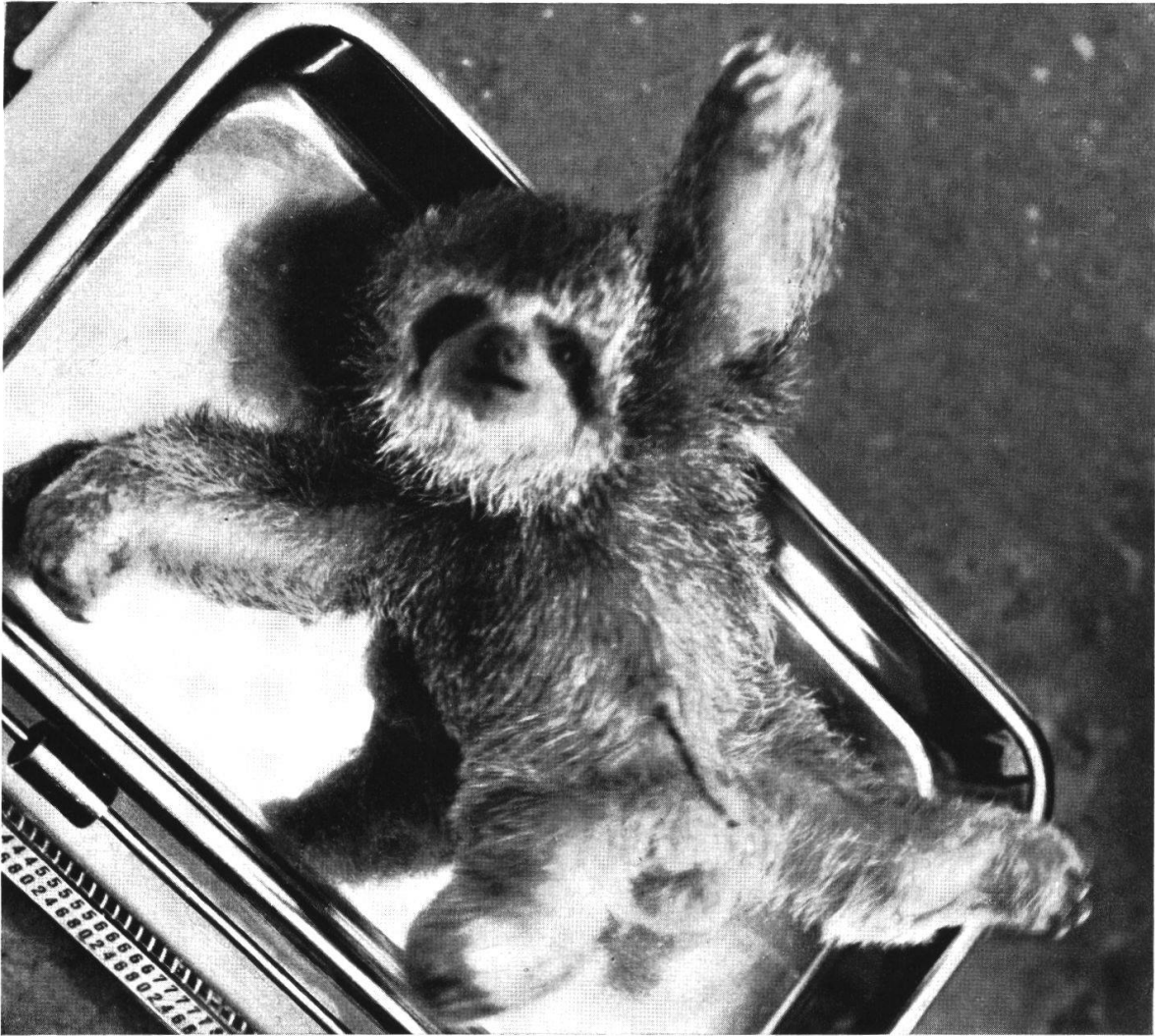
Abb. 1. Männchen von B. infuscatus flaccidus , 4 Stunden alt, zeigt die typische helle Färbung des Neugeborenen, die noch schwach pigmentierte Schnauze und den rundlichen Säuglingsbauch mit dem Nabelschnurrest. Ohne Halt, auf dem Rücken liegend, sind die Glieder hilflos ausgestreckt.

rade zwischen den Zähnen hält, versucht es mit den Klauen zu greifen und kaut gierig daran (Abb. 2). Das Heben des Kopfes ist eine große Anstrengung. Nach 3—5 Minuten ist es jeweils ermüdet und kriecht in das Fell an die Zitzen zurück. Wenn das Kind saugt, nickt die Mutter meist ein. Wenn sie erwacht, beugt sie den Kopf über das Junge und berührt es mit der Nase. Sie läßt nun das Kind ruhig anfassen. Es schaut nach meinem Finger und greift mit den Klauen danach. Nur wenn man es festhalten will, sperrt es sich und versteckt sich im Fell der Mutter. Als es endlich gelingt, seine Schnauze zu öffnen, zeigt sich ein vollständiges Gebiß (Abb. 3).