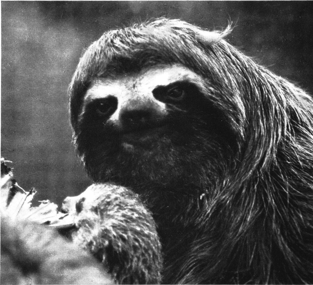
Abb. 2. Das Junge frißt am 4. Lebenstag mit der Mutter Cecropiablätter.

Männchen von B. g. griseus , 4 Tage alt.