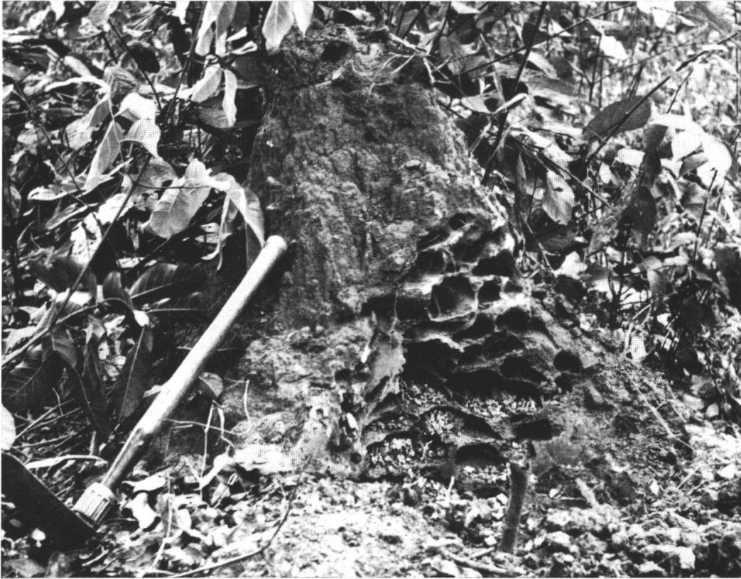
Abb. 2. Oberirdische Nesthügel von Pseudacanthotermes spiniger mit Pilzgärten in den basalen Kammern.

Wie bei den vorigen Termiten liegen die Fundorte von P. spiniger auf den nordwestlichen Bergen oder am Fuß der Berge auf beiden Talseiten. Abgesehen von den Funden von HARRIS (1936) am Ostufer des Tanganyikasees ist diese Art bisher noch nicht in Ostafrika nachgewiesen worden. Es ist anzunehmen, daß sie auch im zentralen Hochland von Tanganyika vorkommt.