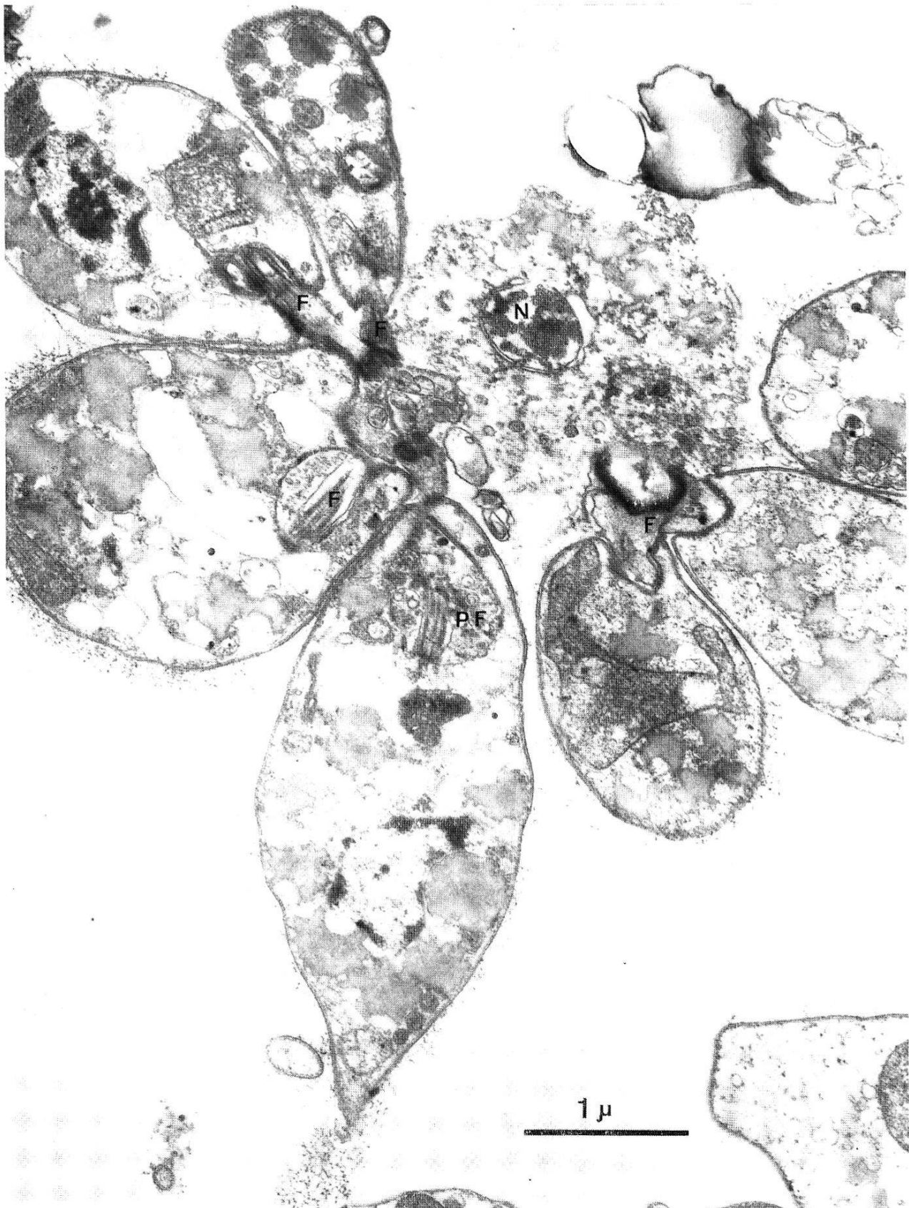
Fig. 2. Coupe à travers une rosace de Leptomonas ctenocephali . Le centre de cette rosace est occupé par un leptomonas lysé dont on distingue encore très bien le noyau (N) et la membrane nucléaire. Les leptomonas vivants orientent tous leur flagelle (F) et avec lui leur poche flagellaire (PF) vers la cellule lysée. Chez deux des leptomonas vivants, la poche flagellaire est occupée par de nombreux organites, provenant de la cellule lysée.