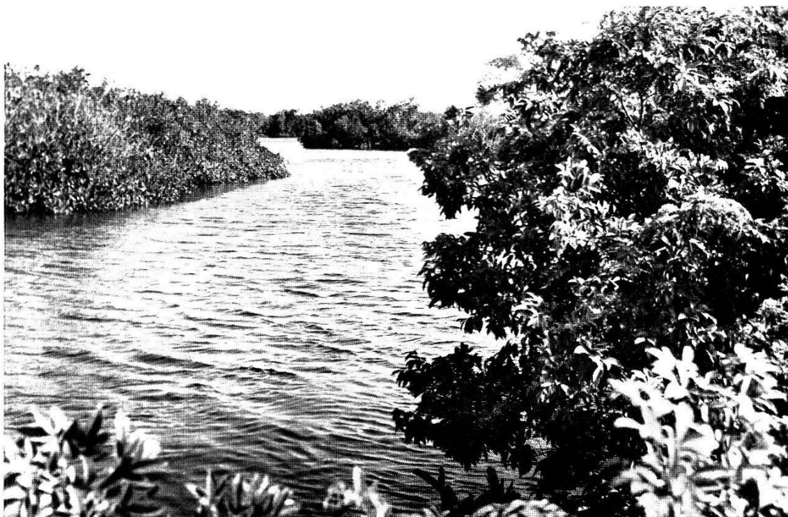
« Bolon » à Rhizophora . Au premier plan à droite Dialium guineense .

tous, mais affirment avec force, et on les croit, qu'elles tirent leur efficacité des paroles rituelles prononcées et de la faveur de Dieu.