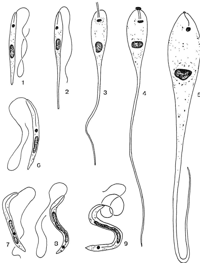
Fig. 2. « H. mirabilis » aus der PR des Enddarms. 1 promastigote Ausgangsform, 2–5 Übergangsformen zur cercoplasmatischen Form, die ans Enddarmepithel angeheftet ist, 6–7 Übergangsformen zur opisthomastigoten Form, 8–9 opisthomastigote Formen. Vergr. 3000 \times .

Die amastigote Form (Fig. 1, 8) war bei eingefangenen Fliegen nie anzutreffen. Sie trat nur bei Übertragungsversuchen auf sowie bei Infektionsversuchen mit Kulturen. Die amastigoten Formen haben einen kugeligen bis oval-länglichen Zellkörper bei einer Länge von 5–8 \mu . Der Kern ist oval und liegt meist etwas exzentrisch; der Kinetoplast erscheint kugelig mit einem Durchmesser von ca. 1,5 \mu . Weder eine freie, noch eine im Zellinneren verlaufende Geißel war lichtmikroskopisch festzustellen. Zellteilungen konnten keine beobachtet werden.