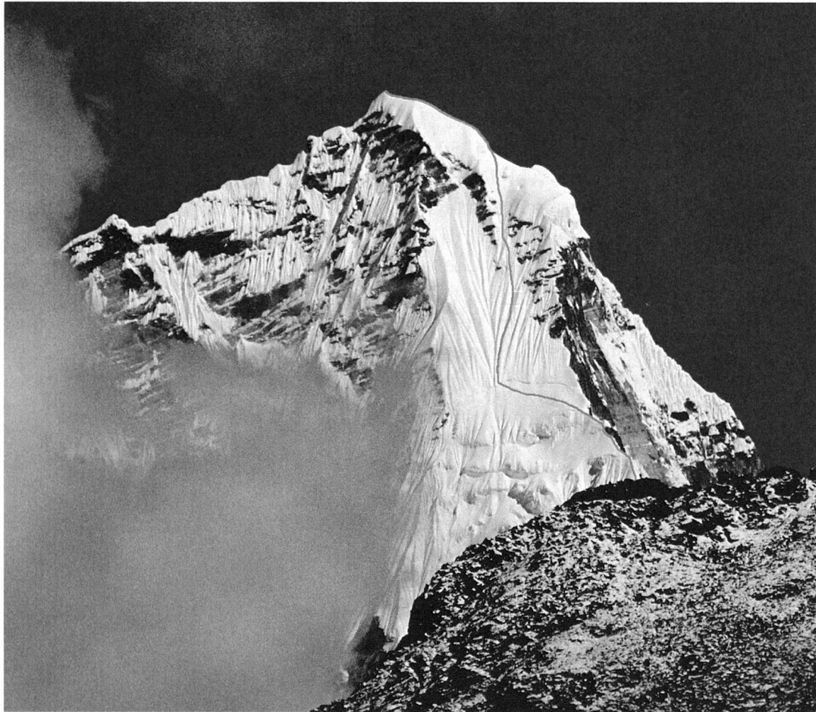
Kyashar von Südosten (von Tangnag aus) gesehen, mit eingezeichneter Route.

Dann folgten 3 schwierige Seillängen (Kletterschwierigkeit ca. 5-6 UIAA) in brüchigem Fels, um den schneebedeckten Teil des Westgrates zu erreichen. Auf einer Höhe von etwa 6400m verliessen wir den Schnee Grat wieder und stiegen in den bis zu 65 Grad steilen Eisrinnen in der Westwand zum Gipfel auf, den wir am 18. Oktober um 16 Uhr erreichten. Nach dem nächtlichen Abstieg über die selbe Route, brauchten wir einen Rasttag im Hochlager, um in der darauf folgenden Nacht nach Tangnag abzustiegen, wo wir uns wieder mit unseren Trägern und mit Kevin trafen.