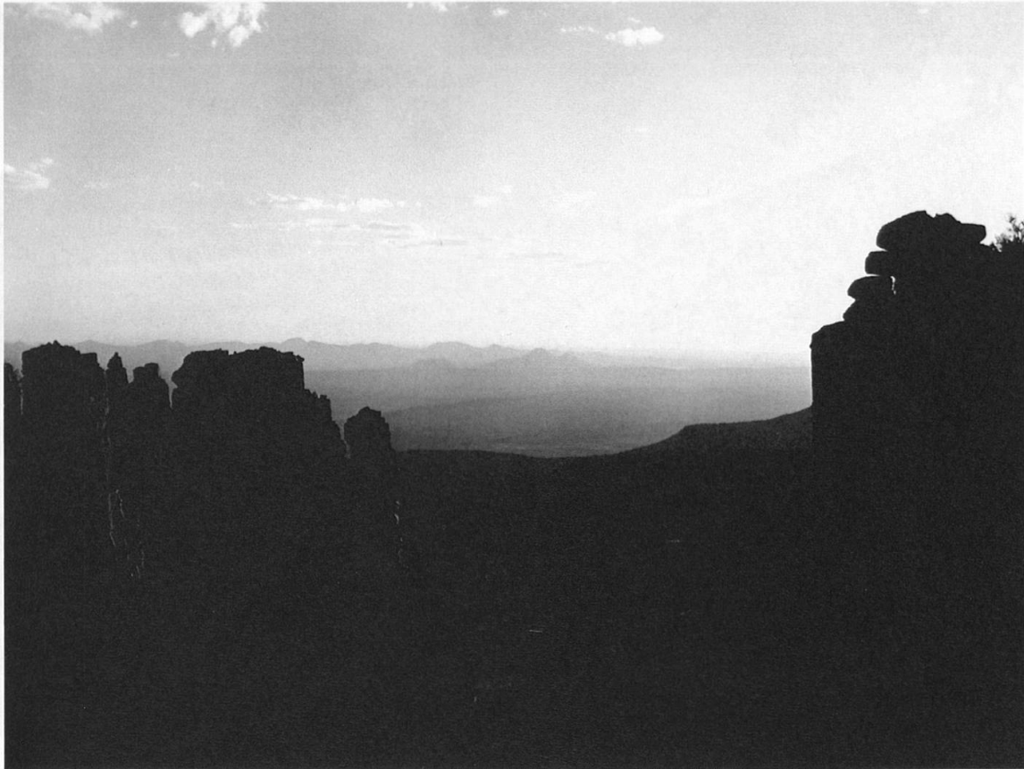
Das Valley of Desolation, Teil des Escarpments oberhalb von Graaff-Reinet.

Vielfalt, die weltweit ihresgleichen sucht. Etwa 7000 Pflanzenarten sind hier präsent, und jährlich werden weitere entdeckt. Ein Drittel aller Sukkulentenarten der Welt ist im südlichen Afrika zuhause.