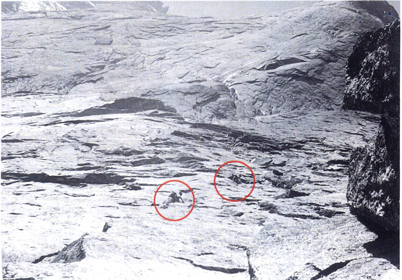
Bild unten: 6. Seillänge (V+) in der Badile NE-Wand auf der Via Cassin. Rébuffat: «Was einer kann, kann ein anderer auch.» Aber in Bergschuhen mit Vibramsohlen klettert da kaum einer mehr.