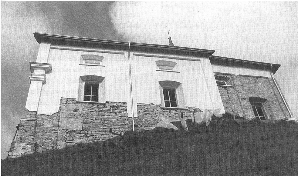
Abb. 6: Cumbel 1996–1999, Sogn Murezi. Südfassade mit Mauer des Vorgänger- baus. Foto von Süden.

wieder abgebrochene) Sakristei südlich des Chores erst nach 1716 angebaut, obwohl an die Türöffnung für den Durchgang in den Chorraum schon damals gedacht worden ist. Ebenfalls später entstand das aktuelle, tonnenförmige Schiffsgewölbe, das die 1716 ursprünglich vorgesehenen Oberlichter in den Längsmauern nicht berücksichtigt. Zimmerleute, die jüngst die Gewölbeoberfläche reinigten, fanden denn auch die dort in den Mörtel eingeritzte Jahrzahl 1749. Da die Emporenbalustrade in originale Mäandermalereien von 1716 einbricht, muss auch die Empore über dem Eingang in späterer Zeit eingebaut worden sein.