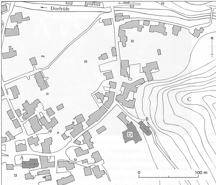
Abb. 77: Trimmis, ev. Kirchgemeindehaus. Planausschnitt von Trimmis mit Lage der beiden Kirchen, der Burgstelle und der Grabungsfläche. A: Katholische Pfarrkirche St. Carphorus; B: Evangelische Pfarrkirche (früher St. Leonhard); C: Burgstelle; D: Grabungsareal. Mst. 1:3000.

bäudestrukturen waren aber nicht zu finden. Vereinzelt auftretende Keramikscherben datieren diese frühesten Befunde in die späte Bronzezeit, d. h. in den Zeitraum von 1300 bis 800 v. Chr. Nach einer länger anhaltenden (Feucht-?)-