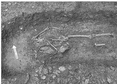
Abb. 82: Trimmis, ev. Kirchgemeindehaus. Teilweise gestörtes Erwachsenengrab. Blick von Süden.

Mit welchem grossen Interesse die Trimmiser Bevölkerung die archäologischen Grabungen verfolgte, wurde während einer öffentlichen Führung im Frühjahr 2000 deutlich. An zwei Tagen orientierten wir überdies die Schülerinnen und Schüler, welche klassenweise die Grabung besuchten. Ein Lehrer der damaligen 1. Sekundarstufe nahm diese Führung zum Anlass, seine Klasse einen Aufsatz zum Thema "Sensation in Trimmis" schreiben zu lassen. Als Ergebnis entstand eine einzigartige, wundervolle Sammlung von Kurzgeschichten, die ich auf keinen Fall vorenthalten möchte. Stellvertretend für alle Arbeiten folgen nun zwei Aufsätze, wobei die Auswahl wirklich nicht leicht fiel.