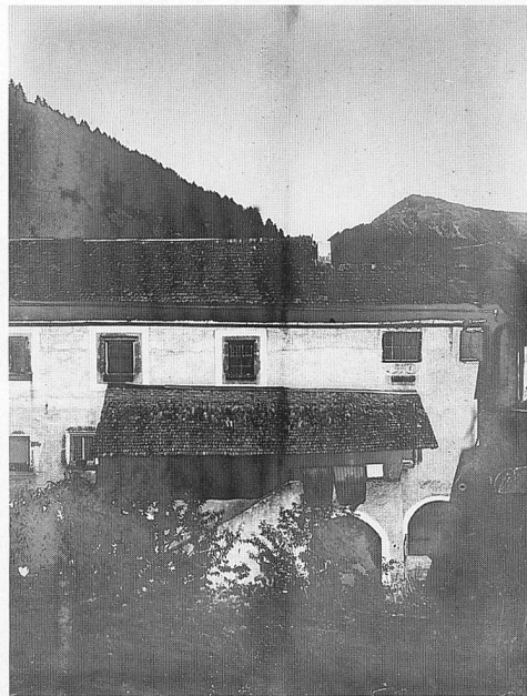
Abb. 111: Müstair, Kloster St. Johann, Nordhof. Treppe aus dem 16. Jh. von Süden, um 1910.

Nord- und Ostwand. Unter der barocken weiss-blauen Fassung ist die spätgotische Schreinerarbeit aus der Zeit der Äbtissin Angelina von Planta an der feingliedrigen Bälkchendecke, am profilierten Unterzug in der Raummitte und an den zugehörigen reich geschnitzten Wandstützen weiterhin ablesbar. So zeugt das ehemalige Refektorium im Plantatum in seiner heutigen Erscheinung von der 500 Jahre alten Geschichte seiner Ausstattung.