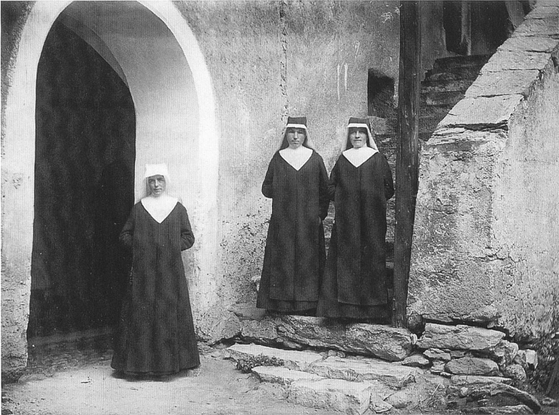
Abb. 110: Müstair, Kloster St. Johann, Nordhof. Treppe aus dem 16. Jh, um 1910.

Müstair, Kloster St. Johann. Massnahmen der Denkmalpflege