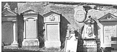
Abb. 25: Sta. Maria V. M., evangelische Kirche, Sanierung Friedhof. Historische Grabsteine vor der Sanierung. Blick gegen Westen.

Weil der Mörtel auf der Krone weitgehend zerfallen ist, kann man keine Steinnegative und damit auch keine Abbruchkrone zweifelsfrei nachweisen. Bis auf weiteres bleibt die Möglichkeit eines zu breiten Fundamentes nicht vollständig widersprochen. Dennoch scheint uns die Hypothese einer Vorgängerkirche weitaus wahrscheinlicher. Im Osten wurde ein Anbau an diese alte Kirchenecke angefügt. Dessen Mauern sind mit hellerem, etwas feinerem Mörtel gemauert und sind daher nicht gleichzeitig einzustufen. Wenn dieser Mauerrest älter wäre als das Fundament der Vorgängerkirche, so hätte sich sein tieferliegendes Fundament beim Westende als Abwinkelung gegen Süden deutlicher abzeichnen müssen und wäre dort später vom Mauerwinkel der Vorgängerkirche überbaut worden. Weil dies nicht beobachtet werden konnte, gehen wir davon aus, dass die Mauer des Anbaues jünger ist und sich an die alte Kirchenecke angelehnt hatte. Die Aussenlänge der Nordmauer beträgt 6,60 m, das Lichtmass des Innenraums 4 m (bis zur Ostfront der Mauer der Vorgängerkirche). Wenn man davon ausgeht, dass der Anbau in den Winkel zwischen Chor und Schiff der alten Kirche eingefügt wurde, so könnte dieses Mass einen Hinweis auf die Länge des Chors der alten Kirche geben. Das Fundament der Vorgängerkirche hat Merkmale (unterste Steinlagen trocken gelegt, Steinformate sowie Verlegeart), die