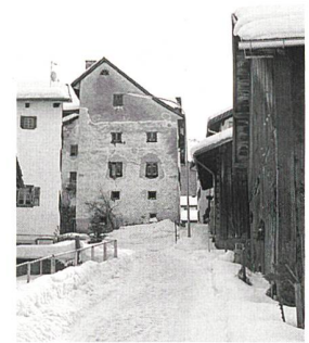
Abb. 168: Tinizong-Rona, Haus Nr. 59. Nordfassade. Aufnahme Winter 2005/06.