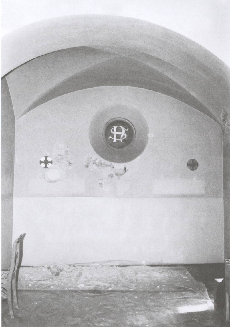
Abb. 7: Ilanz / Glion. Ilanz, Sontga Clau. 1981. Maueruntersuchungen an der Ostwand der 1903 gebauten Nikolaus-Kapelle, vor dem Abbruch im Jahr 1982. Teile der Westfassade mit den Rundfenstern ( oculi ) der im 15. Jahrhundert erbauten Nikolaus-Kapelle sind bis damals in dieser Wand erhalten geblieben. Blick gegen Osten.