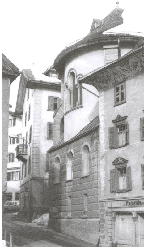
Abb. 4: Ilanz/Glion. Ilanz, Sontga Clau. 1981. Die 1903 von Adolf Gaudy neu errichtete Nikolaus-Kapelle und der Westteil des Hauses Pajarola vor dem Abbruch. Blick gegen Nordwesten.

Anstelle des 1902 abgebrochenen Schwarzen Hauses ist 1903 durch den bekannten Architekten Adolf Gaudy eine neue, wiederum dem Heiligen Nikolaus geweihte Kapelle errichtet worden Abb. 4 . Die unmittelbar östlich anschliessende Häuserzeile, worin sich noch Teile der alten Nikolaus-Kapelle befanden, erhielt damals strassenseitig eine neue Fassade und den Namen Haus Pajarola Abb. 5 . Es ist dieses Haus Pajarola, welches 1982 zusammen mit der neu errichteten Nikolaus-Kapelle des Architekten Adolf Gaudy, sowie dem Haus Columberg weiter westlich, der heutigen, sogenannten Arcada-Überbauung weichen musste. Während der bauarchäologischen Untersuchungen 1981/82, welche vor dem Abbruch des Hauses Pajarola durchgeführt wurden, konnten noch weitere Reste der alten Nikolaus-Kapelle festgestellt werden.