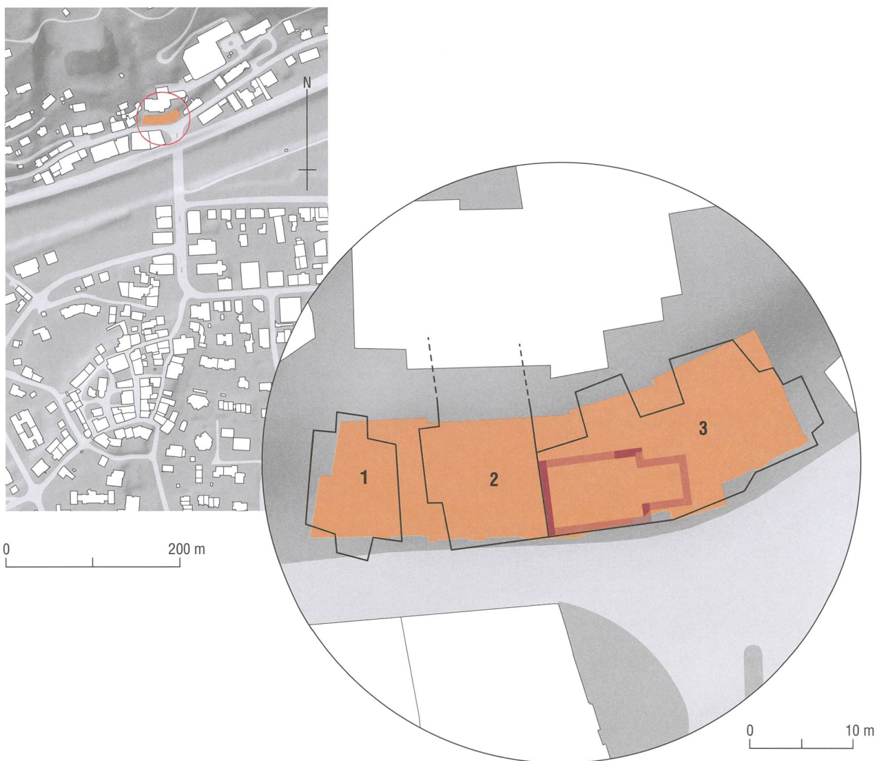
Abb. 1: Ilanz/Glion. Ilanz, Sontga Clau. Plan von Ilanz mit dem linksrheinischen Quartier Sontga Clau. Orange: Die Liegenschaft Arcada, welche 1982 auf dem Grund des Hauses Columberg 1 und der 1903 anstelle des Schwarzen Hauses neu errichteten Nikolaus-Kapelle 2 sowie des Hauses Pajarola 3 gebaut wurde. Rot: Standort der alten Nikolaus-Kapelle. Die stark rot getönten Partien waren 1981 noch als aufgehende Mauerteile im Haus Pajarola vorhanden. Mst. 1 : 6000 und Mst. 1 : 500 (Lupe).

Über die Nikolaus-Kapelle sind wir urkundlich gut unterrichtet. Am 27. Mai 1408 fand die Weihe der Kapelle statt. 1 Sie dürfte kurz vorher vollendet worden sein. Am 1. Juli 1423 wurde ein Altar geweiht. 2 Zwischen 1408 und 1514 sind an die 20 weitere Urkunden ausgestellt worden, die diese Kapelle betreffen. 3 Dabei handelt es sich haupt-