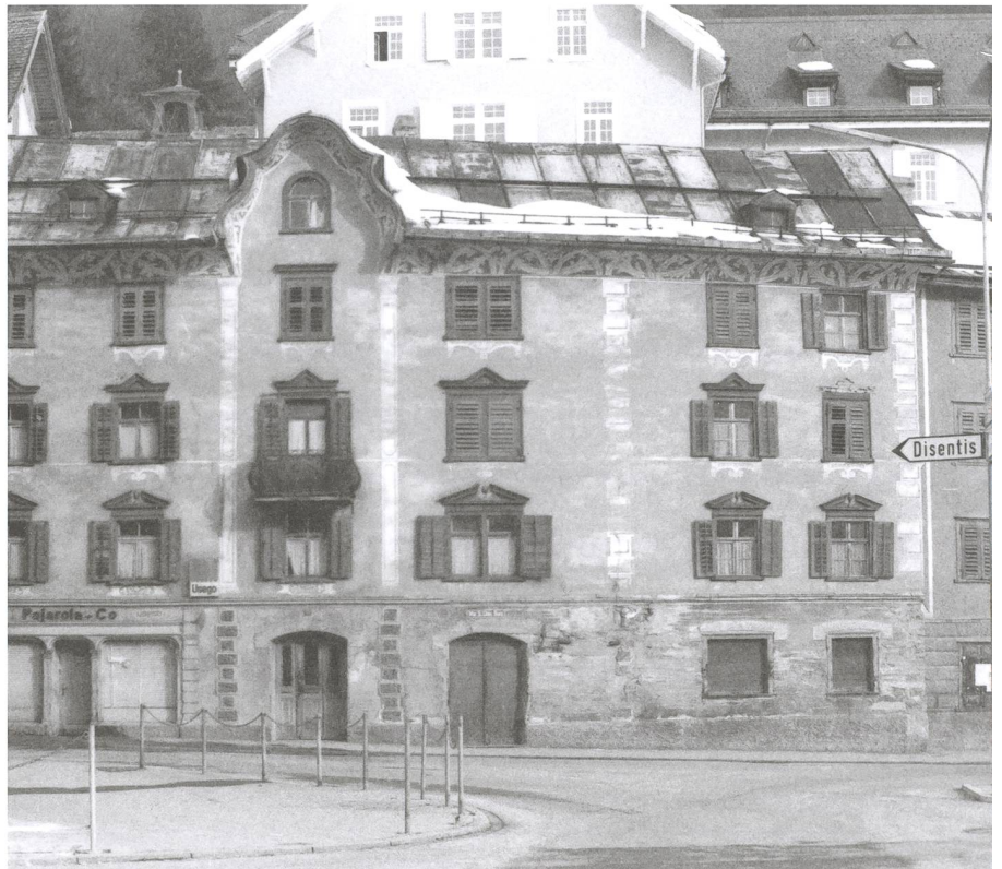
Abb. 5: Ilanz/Glion. Ilanz, Sontga Clau. 1981. Das Haus Pajarola kurz vor dem Abbruch und dem Bau der Liegenschaft Arcada. Blick gegen Norden.