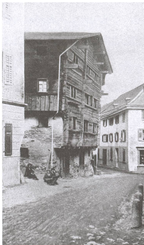
Abb. 3: Ilanz/Glion. Ilanz, Sontga Clau. 1902. Nach dem 1902 erfolgten Abbruch des Schwarzen Hauses wurde der Blick an die östlich angrenzende Häuserzeile frei. Gut zu erkennen ist die ehemalige Westfassade der alten Nikolaus-Kapelle 1 , die noch bis zum Abbruch des Hauses Pajarola im Jahr 1982 erhalten war. Blick gegen Osten.

Abb. 2: Ilanz/Glion. Ilanz, Sontga Clau. Vor 1900. Das sogenannte Schwarze Haus wurde 1902 abgebrochen. An dieser Stelle des Schwarzen Hauses entstand nach dessen Abbruch 1903 die neue Nikolaus-Kapelle. Blick gegen Osten.