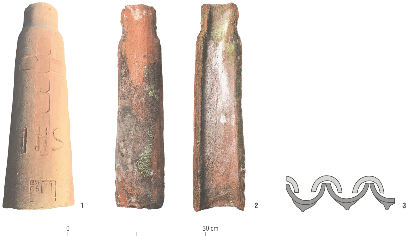
Abb. 6: 1 Replik eines Hohlziegels (Mönch) nach dem Brand im Holzfeuer, verziert mit einem Kreuz, dem christlichen Kürzel IHS und dem Stempel des Burgenvereins Graubünden. 2 Original eines mittelalterlichen Hohlziegels vom Hauptturm der Burganlage Neu-Aspermont. Mst. 1:5. 3 Eindeckung mit Hohlziegeln, schematisch: Nonne (dunkelgrau) und Mönch (hellgrau).

für das händische Formen aber zu trocken und dadurch zu wenig plastisch ist. Diesen vorgängig von Hand aufzubereiten, hätte den Arbeitsaufwand massiv erhöht und den Rahmen der zeitlichen und personellen Ressourcen gesprengt. Entsprechend mussten Kompromisse gefunden werden.