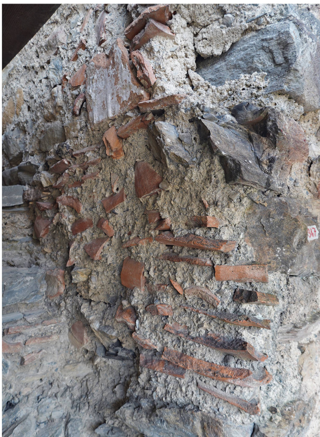
Abb. 2: Jenins, Neu-Aspermont. 2020. Grossflächige Reparatur aus Mörtel und darin verbauten Hohlziegelbruchstücken am Hauptturm. Blick gegen Südosten.

Die Autopsie an den Ziegeln zeigte, dass es sich um Rinnen- und Deckziegel, sogenannte Nonnen und Mönche, handelt Abb. 6 . Die Nasen – ein dreieckiger Aufsatz an der Unterseite der Rinnenziegel – sind angesetzt, die Oberflächen aller Ziegel sauber gestrichen und die Unterseiten reichlich gesandet. 3 Die eingangs erwähnte Dendrodatierung 1466 liefert einen terminus ante quem für das Alter der Ziegel. 4 Weitere Hohlziegel bzw. Bruchstücke von solchen sind auch bei Reparaturen am Mauerwerk des Turmes verbaut worden Abb. 2 . Dies legt nahe, dass sie erst in einer Zweitverwendung zum Schutz der Mauerkronen des Turmes eingesetzt wurden. Ursprünglich