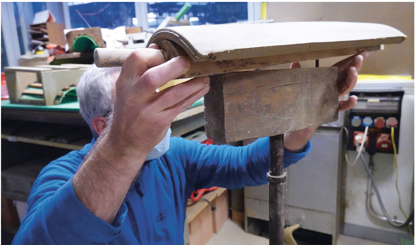
Abb. 5: Rapperswil BE, Ziegelwerk Gasser Ceramic AG. 2022. Für das einfachere Arbeiten sind die Holzleisten drehbar auf Ständern montiert.

Bei diesen Versuchen zeigten sich aber auch Probleme: Beim Absenken und Andrücken der Lehmplatte auf der Holzleiste bildeten sich Risse Abb. 4 , die zwar verstrichen werden können, für die Haltbarkeit der gebrannten Ziegel aber ein erhebliches Risiko darstellen. Sie sind eine Folge des industriell aufbereiteten Ziegellehms, der sich zwar für die maschinelle Pressung eignet,