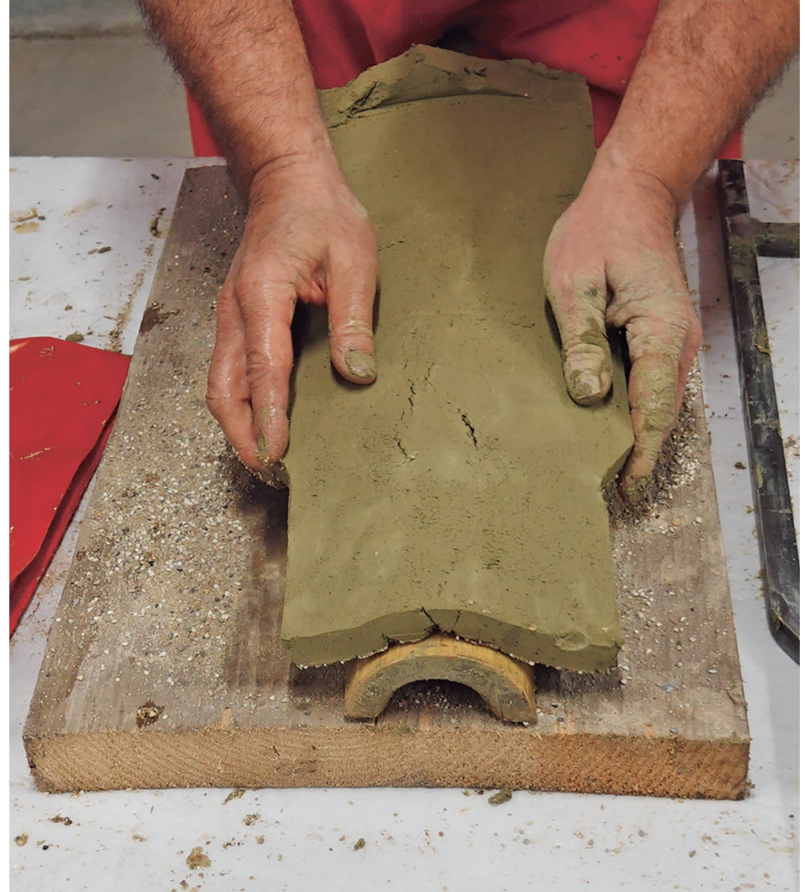
Abb. 4: Cham/Hagendorn ZG, Ziegelei-Museum. 2022. Formen des Ziegels auf dem Leisten. Im Bereich des Einzuges und dem Übergang zwischen dem breiten und schmalen Ziegelteil bilden sich deutliche Risse.

erst gut die Hälfte der Gebäude mit solchen gedeckt. 10 Ob dies mit einer geringen Verfügbarkeit von Ziegeln mangels guter Tonlagerstätten zusammenhängt, ökonomische Gründe dahinterstecken oder dies mit einer grundlegenden Skepsis der Bündner Bevölkerung gegenüber Ziegeln zusammenhängt, wäre mit einer detaillierten Untersuchung zu klären. Gegen die erste Annahme sprechen zumindest die herausragende Baukeramik des Lettners im Kloster St. Nicolai, Chur 11 sowie die Erwähnung einer Ziegelhütte im Churer «Sand» durch Ulrich Campell im Jahr 1572. 12