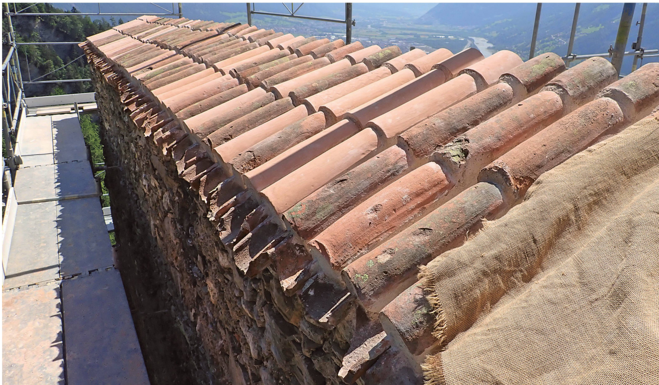
Abb. 7: Jenins, Neu-Aspermont. 2022. Die mit neu hergestellten Hohlziegeln ergänzte Kronenabdeckung des Wohnturms. Blick gegen Süden.

Handwerker nicht nehmen, den einen oder anderen Ziegel phantasievoll zu verzieren Abb. 6 . So konnten innert 4 Tagen 689 Ziegel hergestellt werden, also etwas mehr als die erforderlichen 500.