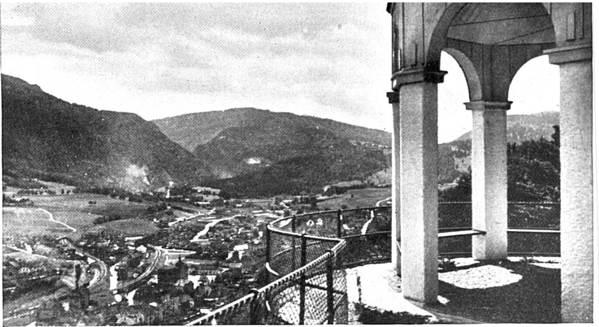
MOUTIER vue du pavillon