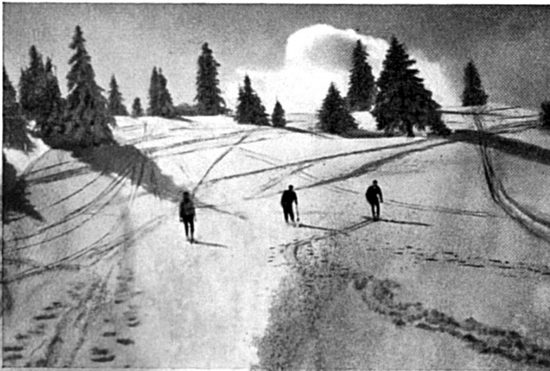
Piste de ski de l'Obergrenchenberg