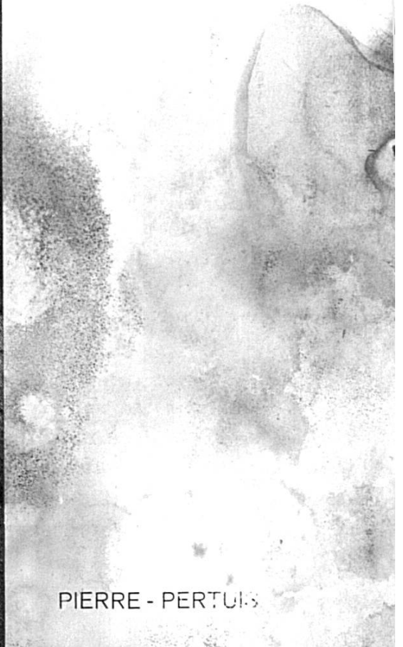
PIERRE - PERTUIS