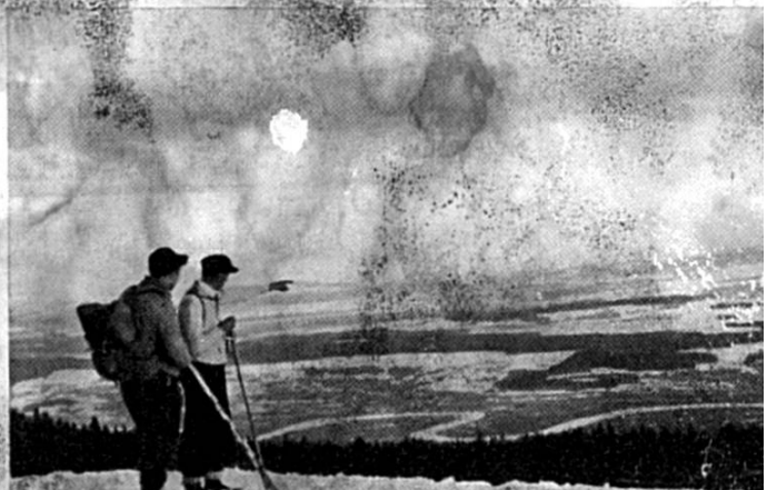
Vue depuis l'Untergrenchenberg sur la vallée de l'Aar et le plateau suisse