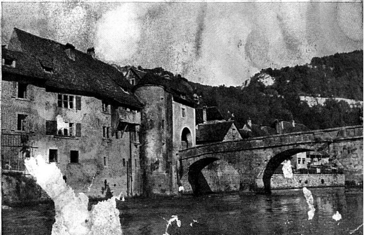
-UF ANNE e Doubs