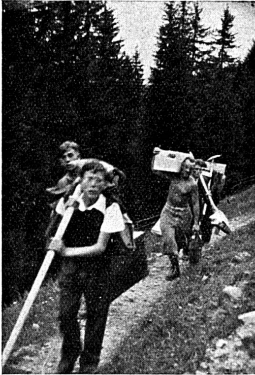
La montée au camp d'Eriz

Ces colonies de travailleurs volontaires donnèrent l'idée d'organiser des camps similaires pour les jeunes chômeurs et sont