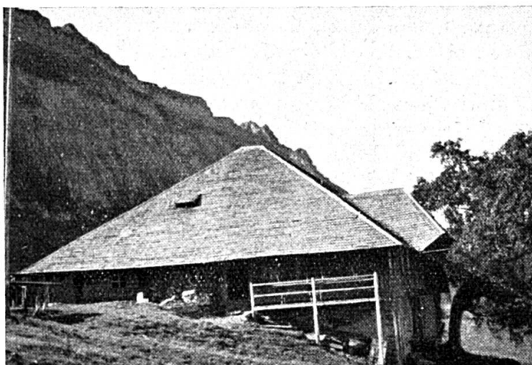
Le chalet du camp (Ober-Hörnli)

e) A une allocation de fr. 6.- par semaine.