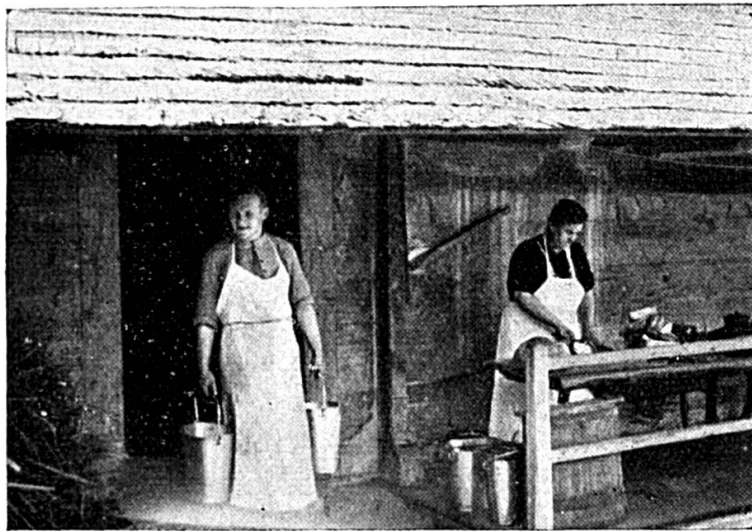
La seconde maman

Pour les adultes le chômage est une source de soucis et d'oppression matérielle. Pour les jeunes il représente quelque chose de pire : dégoût et mépris de la société qui les abandonne, perte du sentiment des respon-