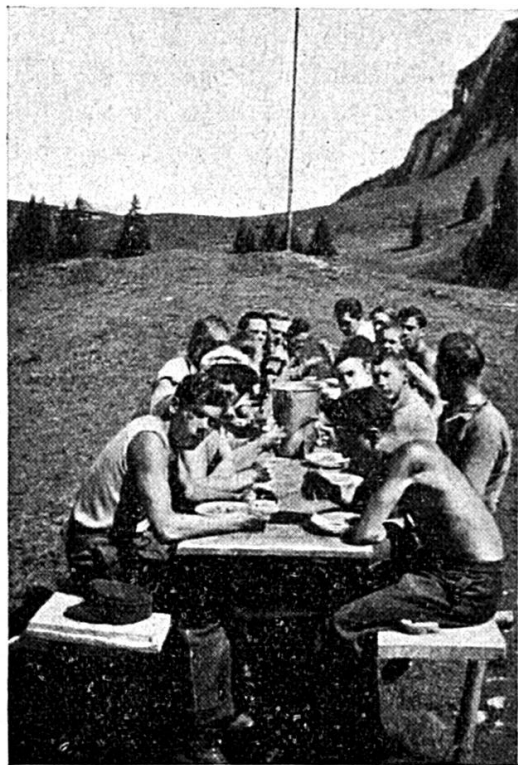
Un repas en plein air

Le reste, soit les services de table et les vivres furent achetés. Enfin, l'outillage de chantier (sauf les pelles qui furent également achetées) fut loué chez un entrepreneur de la place. Avec ce matériel, chargé sur un grand camion, nous nous acheminions en remontant la vallée de la Zulg à Horrenegg, hameau de la commune d'Eriz, point terminus des chemins carrossables. Le camion déchargé, le matériel remisé dans un chalet, nous partions à 16 heures pour notre alpage du Hörnli (altitude 1450 m.). Après une heure de marche à travers pâturages et forêts nous prenions possession de nos pénales.