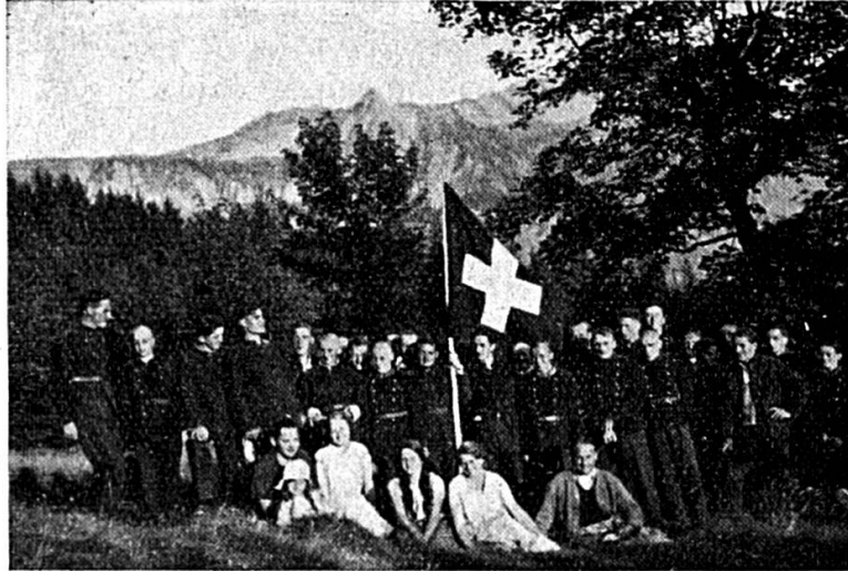
Le 1er août au camp

Le chalet qui nous abrite est construit entièrement en bois et couvert de bardeaux avec devant la porte « de l'écurie » un vieil érable (Chanson). Le dortoir jusqu'ici était dans la grange sous le toit, les interstices capitonnés au moyen de branches de sapin. Nous déménageons aujourd'hui dans une des écuries nettoyées à fond et blanchies par l'équipe de notre brave petit « Rouet ». Cette pièce sera plus chaude et donnera par mauvais temps un meilleur abri contre le vent.