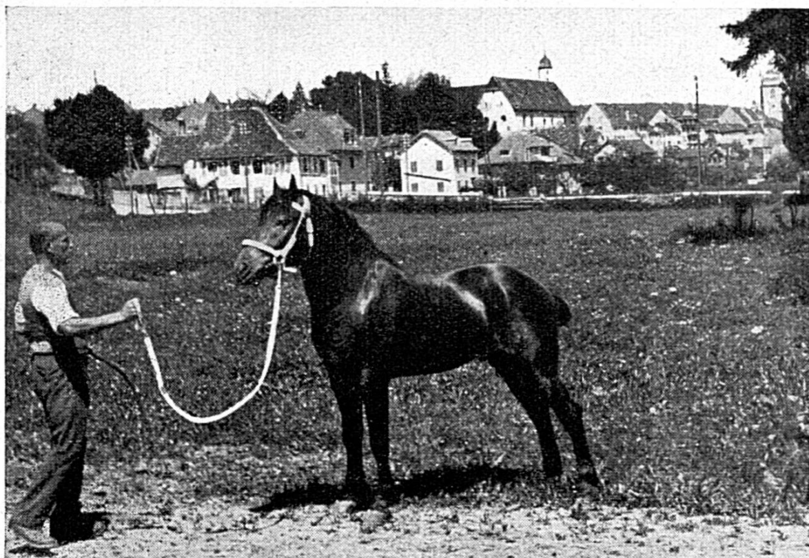
Bivouac , étalon de 3 ans, par Signal et Orange , aux frères Nussbaumer, Porrentruy