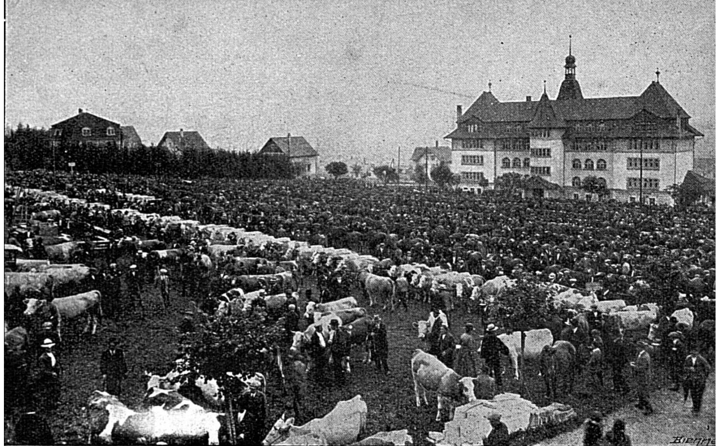
Une vue de la Foire de Chindon