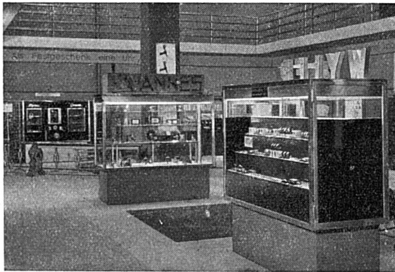
La Foire de l'horlogerie

Le bâtiment principal est le premier de l'ensemble ; on y pénètre par sept grandes portes qui donnent accès au vestibule d'entrée. De spacieux escaliers de marbre conduisent de là aux salles de fêtes de la Foire. Dans le bâtiment principal se trouvent également les bureaux de la Direction, de nombreuses salles de conférences, des bureaux et magasins, puis, à gauche des portes d'entrée, le grand restaurant ; l'aile droite contient le bureau des postes, téléphone et télégraphe. Le vestibule d'entrée conduit à la