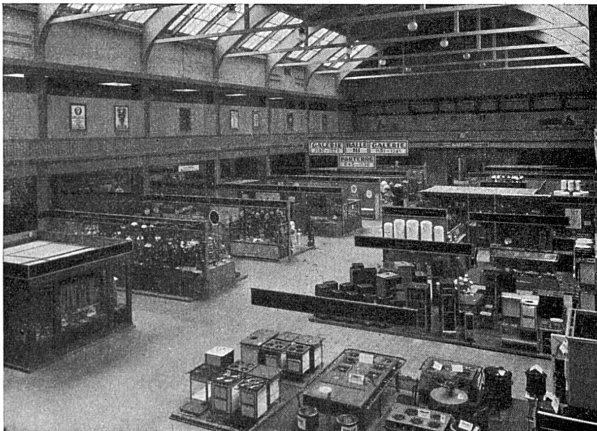
Vue de la Halle III

est une construction démontable le long de la halle VI qui fut édiflée pour la première fois en 1935. Elle abrite les machines pour le travail du bois, que l'on peut y voir en activité.