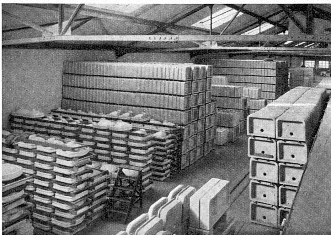
Vue partielle du magasin d'articles sanitaires. Teilansicht des Magazins sanit. Spüllwaren.

La fabrique de céramique produit en ce moment les articles les plus divers et les plus variés quant aux formes et aux couleurs. Elle se place de ce fait au centre de l'industrie céramique suisse. Elle est à la tête aussi des perfectionnements techniques de la fabrication et dans ce domaine elle a fait réaliser des progrès considérables à l'industrie céramique du monde entier, grâce à l'initiative et au courage de ses chefs. Elle a servi de champ d'expérience pour la mise au point de nouveaux procédés de cuis-