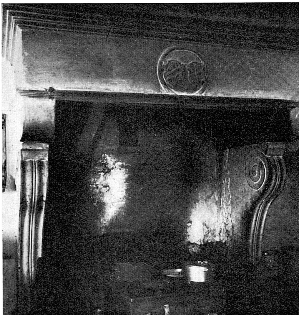
Manteau de la cheminée de la salle des chevaliers