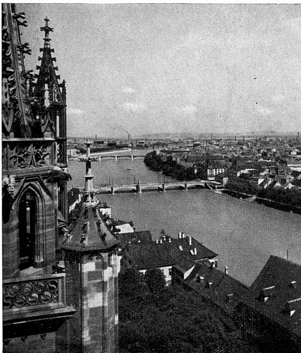
Une jolie vue de Bâle prise d'une des tours de la cathédrale

Instrument de prospection qui s'adresse à un public d'intéressés seulement et simultanément moyen de vulgarisation qui doit atteindre la foule, la Foire n'est-elle pas en contradiction avec son principe même ? Si vraiment elle existe, cette contradiction ne doit être qu'apparente, car le problème sur lequel repose l'institution, le problème dont on pourrait prétendre qu'elle procède est celui du travail. On a dit d'elle qu'elle était la fête du travail ; elle est quelque chose de plus, elle en est l'expression même, tantôt rutilante aux multiples facettes qui charment le regard, tantôt à la voix profonde et grave qui incite à la réflexion. A ce titre, elle intéresse aussi bien l'industriel qui