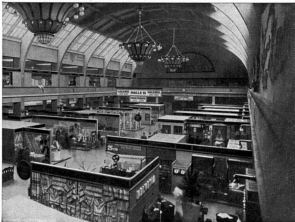
Halle II. Textile