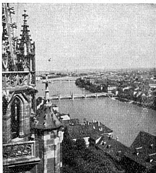
Le coude du Rhin