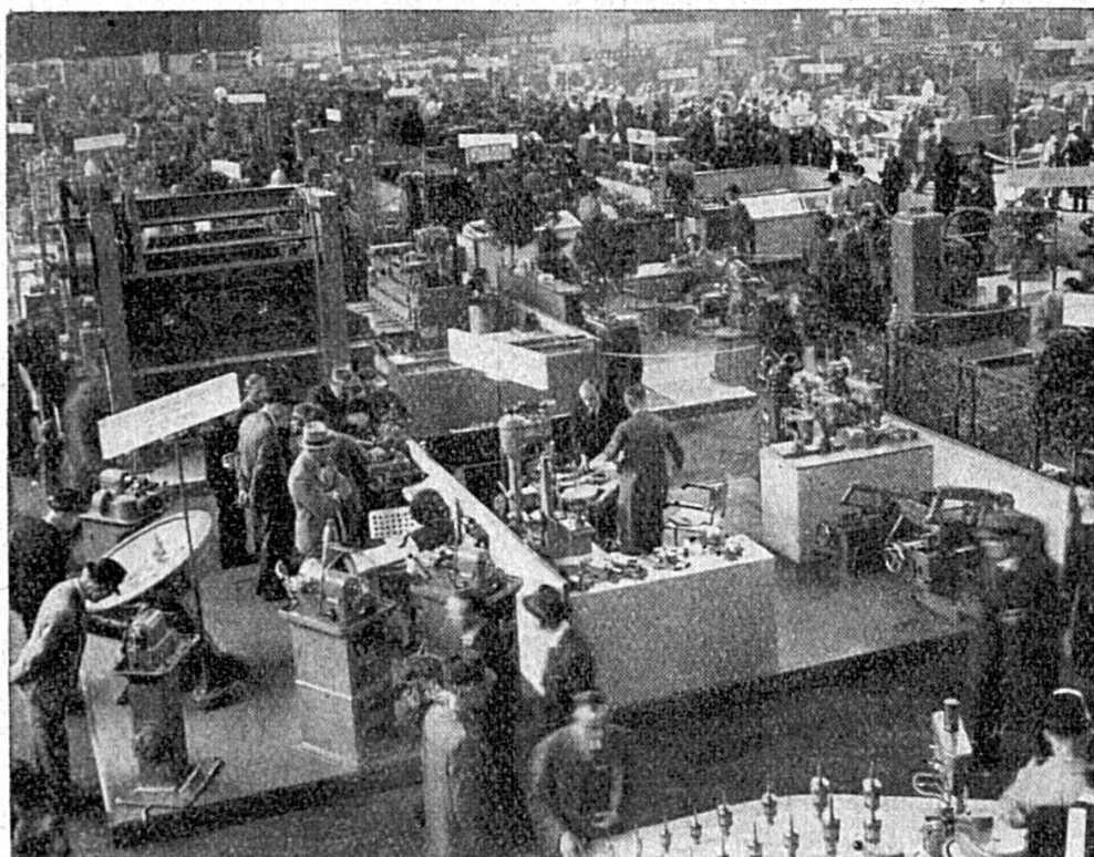
Un secteur de la halle aux machines

pes 2, Bureau et magasin, et 5, Papier, arts graphiques et réclame, section à laquelle s'est joint l'emballage, la halle X est en outre réservée à l'industrie des appareils de radio. Dans la halle XI ont trouvé place les fournisseurs des arts graphiques. La halle XII est devenue celle des besoins ménagers, groupe qui a pris passablement d'extension et qui se tenait dans la halle III. La majeure partie de la halle XIII comprend les fournitures industrielles ; il s'y ajoute les machines-outils et les machines à travailler le bois qui, faute de place, n'ont pu être exposées dans les halles VI et VII. Quant à la halle XIV, elle groupe les stands de dégustation.