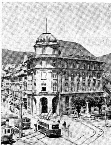
Hôtel de la Banque à Bienne