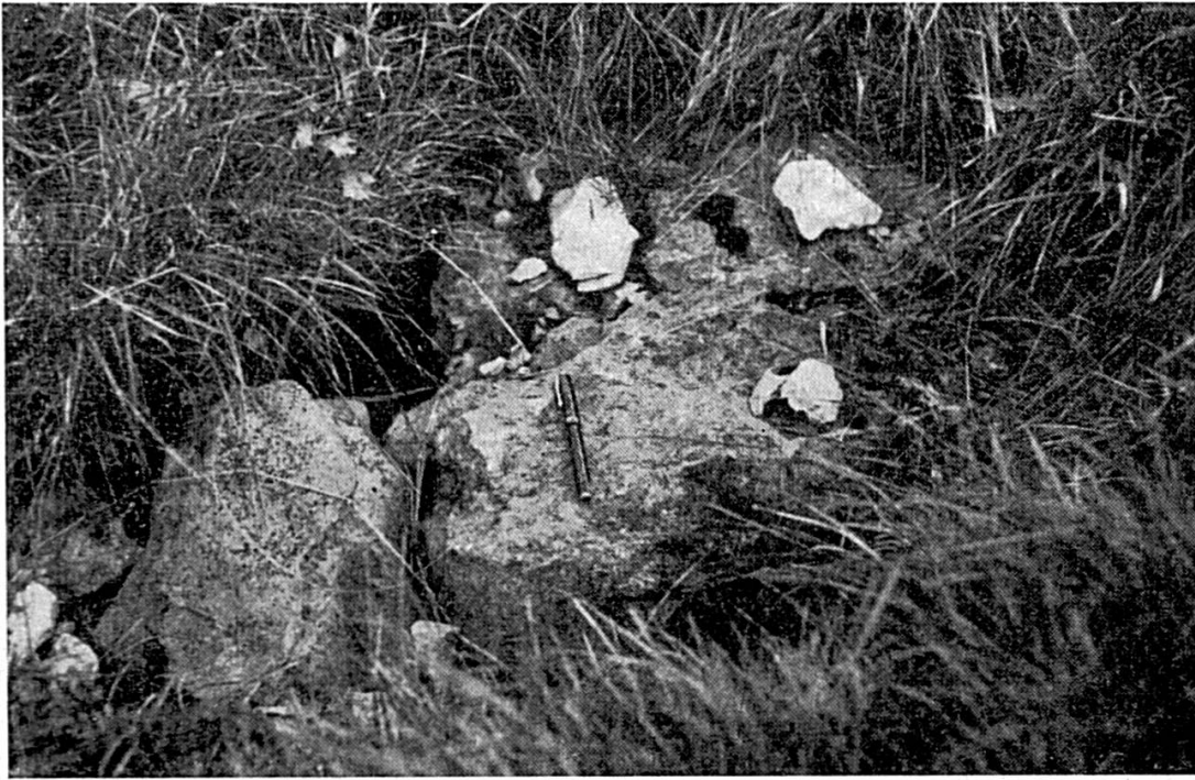
Fig. 4. Petit puits émissif de la Combe des Noires-Terres. Le porte-plume réservoir, au centre de la photographie, permet d'estimer la dimension des fissures.