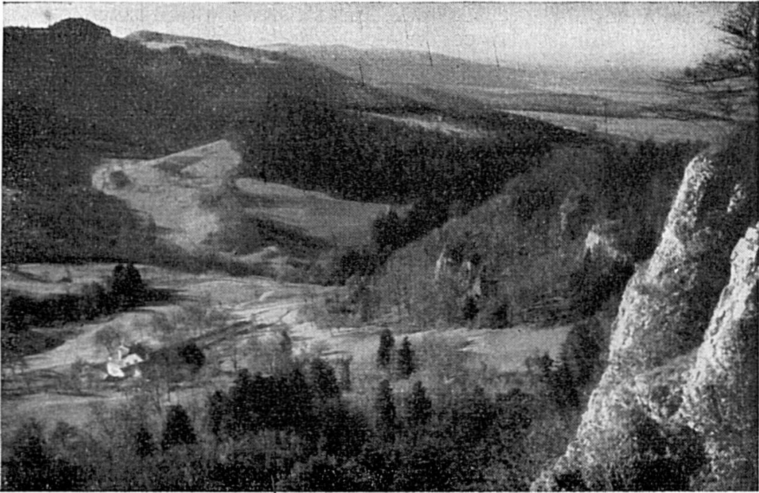
Fig. 2. La combe liasique de « Derrière Mont-Terri », vue du « Camp de Jules César ». Au milieu, la gorge de la « Gypsière » ; plus loin, la clairière de « Sur Moron ». A l'arrière-plan, à gauche, « Sur Plainmont ».