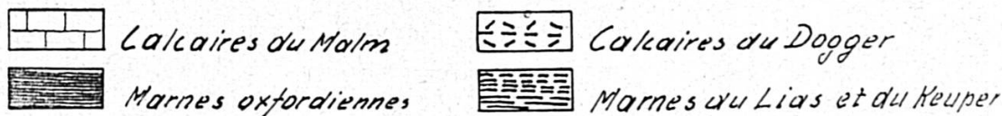
Fig. 1. Bloc-diagramme géologique de la chaîne du Mont-Terri, vue du nord.

sance à des conditions hydrologiques très particulières, que nous discuterons dans la deuxième partie de ce travail.