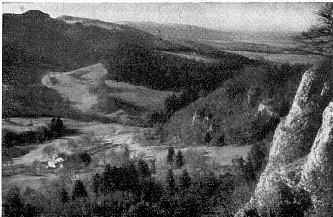
Fig. 2. La combe liasique de « Derrière Mont-Terri », vue du « Camp de Jules César ». Au milieu, la gorge de la « Gypsière » ; plus loin, la clairière de « Sur Moron ». A l'arrière-plan, à gauche, « Sur Plainmont ».