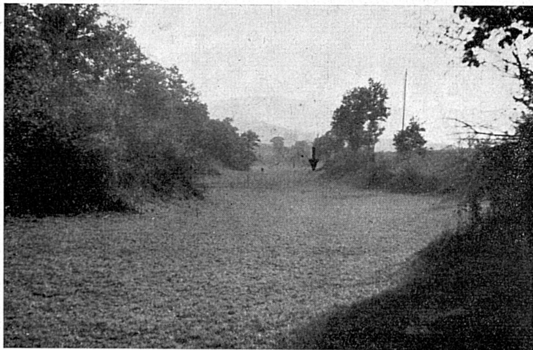
Fig. 3. Vue de la Combe des Noires-Terres, entre les cotes 465 et 480. La flèche indique l'emplacement du petit puits émissif de la fig. 4 (cote 480).