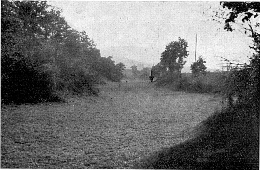
Fig. 3. Vue de la Combe des Noires-Terres, entre les cotes 465 et 480. La flèche indique l'emplacement du petit puits émissif de la fig. 4 (cote 480).