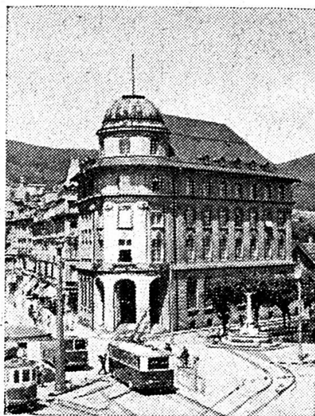
Hôtel de la Banque à Bienne