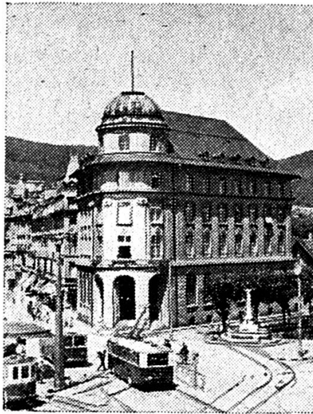
Hôtel de la Banque à Bienne