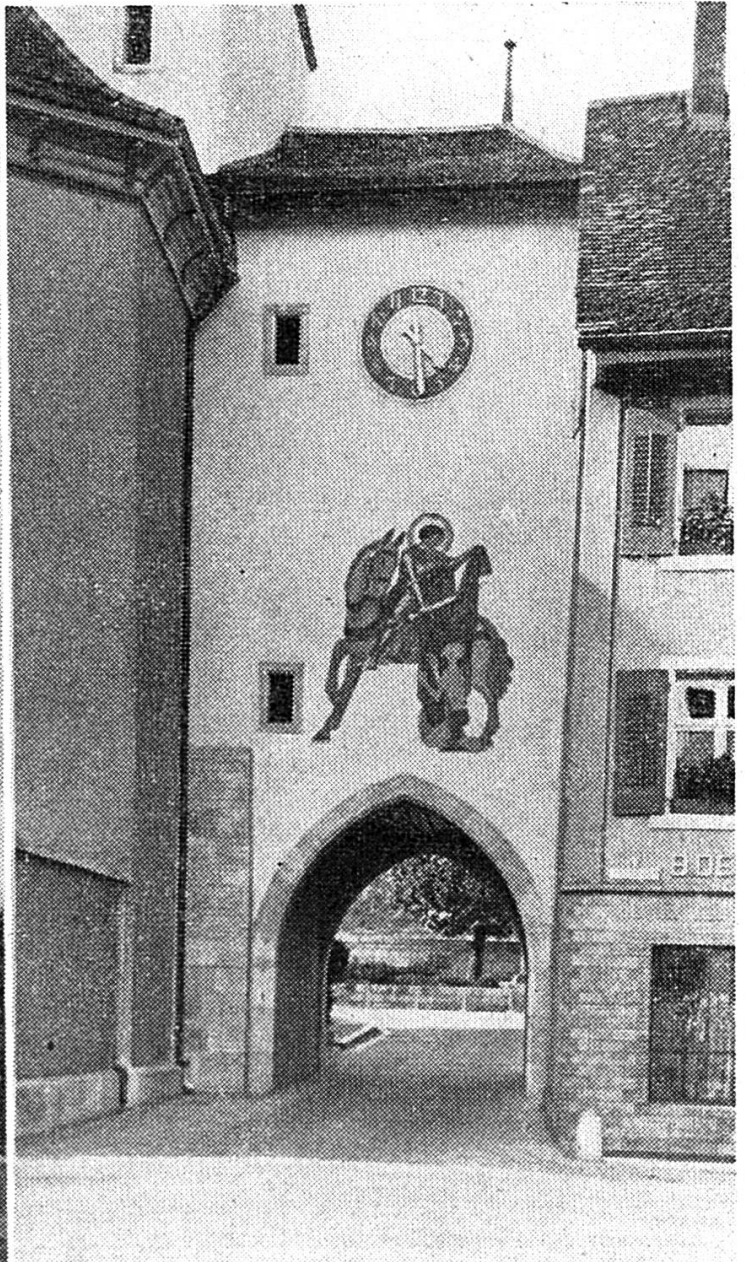
Vue de la porte, côté ville, avec la fresque de Saint-Martin.