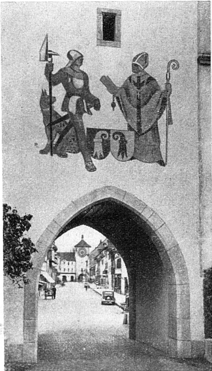
Vue de la porte, côté extérieur, avec la fresque figurant l'évêque Pierre d'Aspelte donnant la lettre de franchise aux Laufonnais, représentés par un guerrier.

Il semble que ceux-ci aient eu à cœur de n'oublier cette bonne exhortation, puisque les délégués des communes du district viennent