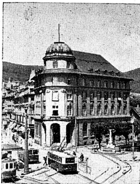
Hôtel de la Banque à Bienne