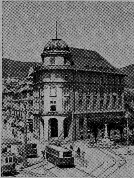
Hôtel de la Banque à Bienne