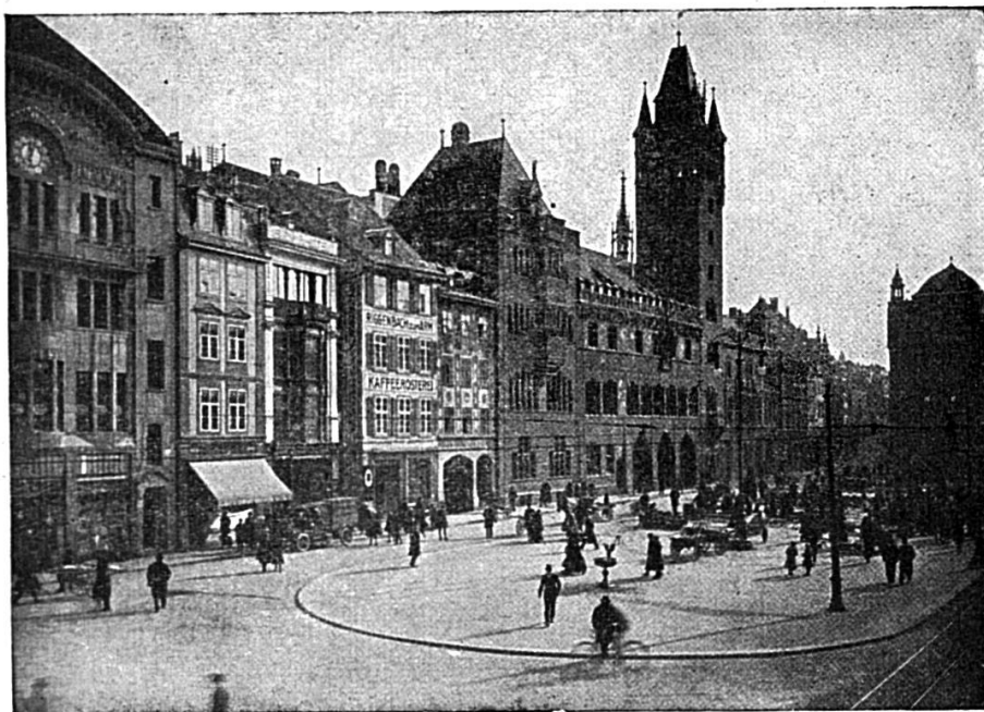
Bâle, Place de l'Hôtel de Ville

C'est précisément dans ces bâtiments à étages qu'il faudra chercher les fournitures pour l'industrie textile, les articles de cuir et de sport, les jouets, les instruments de mesure mécaniques et électriques, les appareils spéciaux, la mécanique de précision, l'optique, la photographie, les appareils médicaux, les ustensiles de laboratoire, l'outillage horloger, etc., c'est-à-dire les groupes spécialisés qui méritent une attention particulière parce qu'ils donnent un remarquable aperçu de ce que peuvent être la variété et la précision de la production suisse.