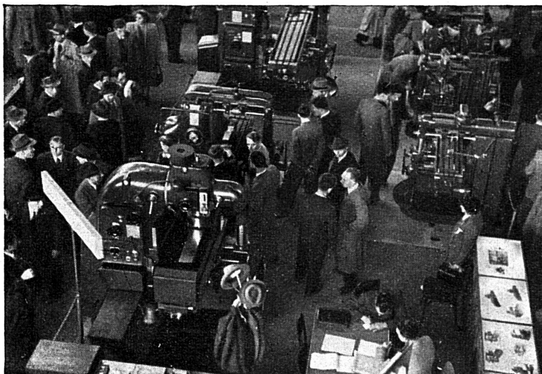
L'intérêt suscité par les machines-outils à la Foire de Bâle

En raison de l'étendue de la Foire et de l'extrême spécialisation réalisée dans ses 17 groupes de produits industriels, il est indispensable d'en prévoir la visite selon un programme bien établi. Il importe donc de prendre note à l'avance des maisons concurrentes représentées, des produits qu'elles exposent, de l'emplacement et de l'ordonnance des groupes professionnels qui vous intéressent au premier chef.