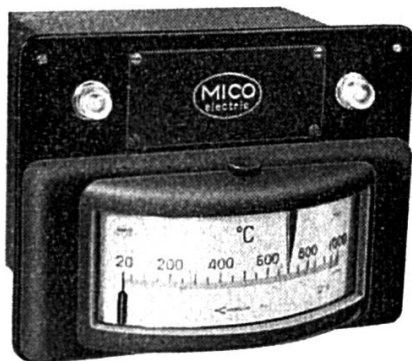
Régulateur électronique de température pour thermo-couple Hoskins Etendue de mesure : 20 — 1000° C

CIE. DES INSTRUMENTS DE MESURES ELECTRIQUES S. à r. l. BIENNE (Suisse) 22 rue de l'Hôpital, Tél. (032) 2 81 56