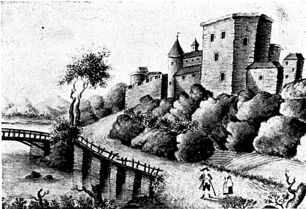
Le château d'Angenstein vu d'amont par un peintre occasionnel du XVIII e siècle. Cette aquarelle est déposée au musée jurassien, Delémont.

On nous signale qu'elle aurait l'intention de l'aménager afin d'y