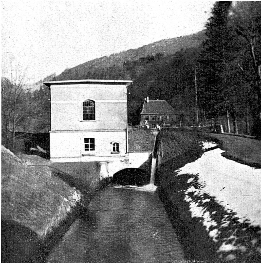
L'ancienne centrale de Bellefontaine

tant il est vrai que les entreprises nouvelles sont toujours séduisantes et d'autant plus que la nôtre va se dérouler sur un fond d'histoire que nous aurions de la peine à vous taire.