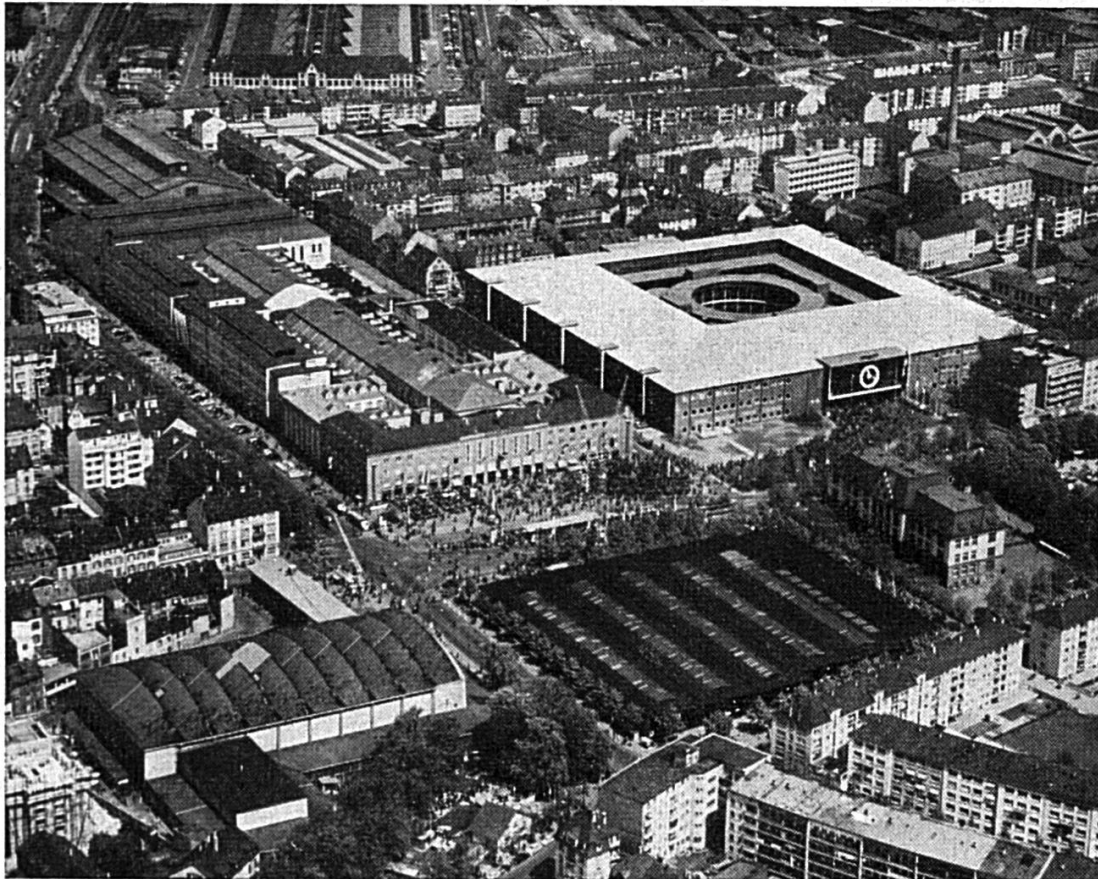
Vue d'ensemble des bâtiments de la Foire de Bâle

Cartes journalières à 2 fr. 50 (ne sont pas valables les 20, 21 et 22 avril, journées réservées aux commerçants). Billets de simple course valables pour le retour. Demandez le catalogue de la Foire, un guide d'information qui vous servira toute l'année.