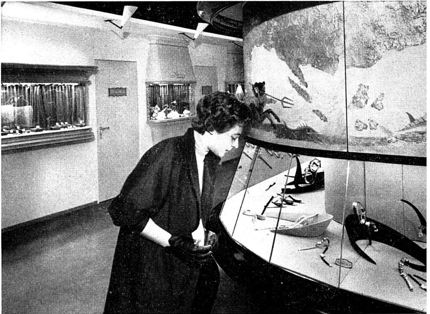
Un secteur du pavillon agrandi de l'horlogerie dans la halle 2

La branche des machines-outils et celle des machines pour l'industrie textile exposent à tour de rôle à la Foire de Bâle. L'année 1956 sera celle des machines textiles dont l'exposition donnera un reflet pour ainsi dire intégral de ce qui se construit en Suisse dans ce domaine. Doyen de la branche des machines, ce secteur est essentiellement orienté vers les affaires d'exportation : il vend à l'étranger 9/10 de sa production. La Suisse exporte presque autant de machines textiles que l'Allemagne et les Etats-Unis, la moitié environ de ce qui s'achète en Angleterre. Si ce secteur industriel d'un pays infiniment plus petit peut se mesurer avec ceux des grandes nations, il le doit aux recherches et aux progrès techniques dont il ne cesse de bénéficier. Comme de coutume, la prochaine Foire Suisse d'Echantillons révélera à ses