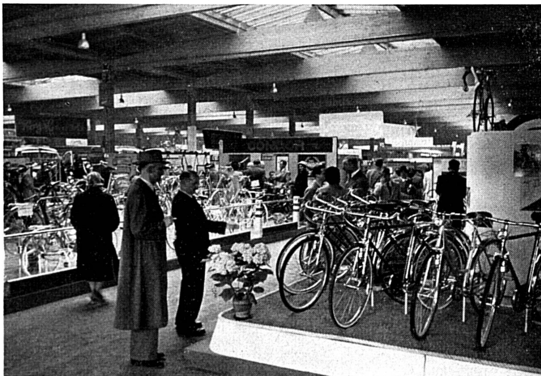
Section du cycle

Pour répondre à la demande toujours plus grande de motocyclettes à cylindrée moyenne, Condor a développé un nouveau modèle dans cette catégorie et expose pour la première fois sa nouvelle Con-