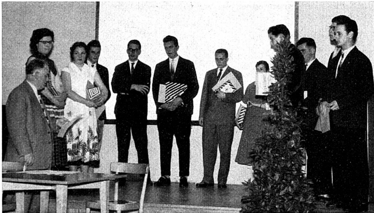
Les lauréats pendant la distribution des distinctions et des prix

Pour un pays qui lutte pour son existence, l'une de ses forces les plus puissantes émane de l'habileté professionnelle de ses citoyens. Une profession bien choisie, bien apprise, bien exercée représente indéniablement la mœlle de toute vie. La profession, c'est la valeur personnelle qui s'affirme dans l'individu, qui déploie en quelque sorte sa volonté de s'exprimer. En elle repose l'intérêt pour les besoins et les exigences de la communauté.