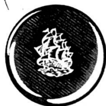
Revers médaillé des réf. 401 et 402

Un symbole de grande précision et distinction