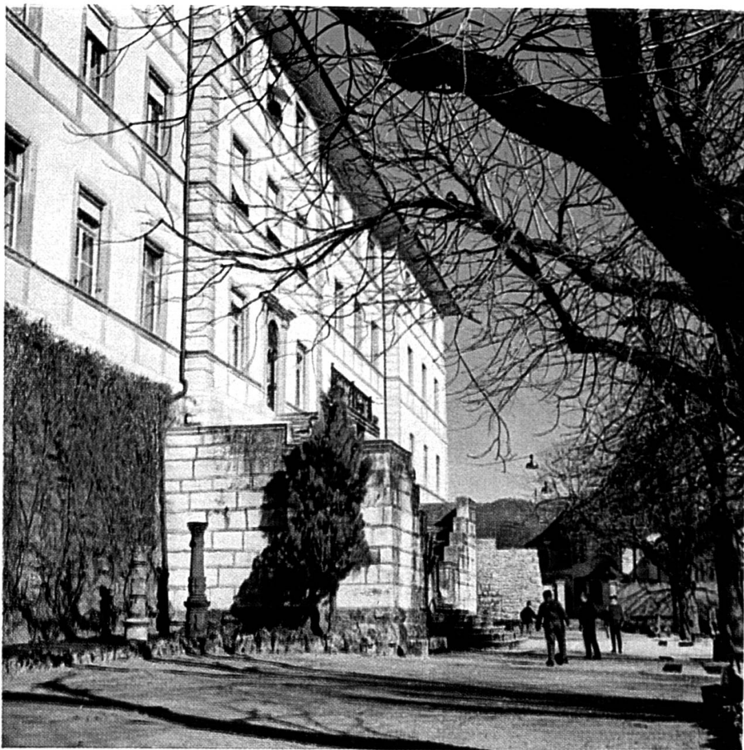
Château de Delémont