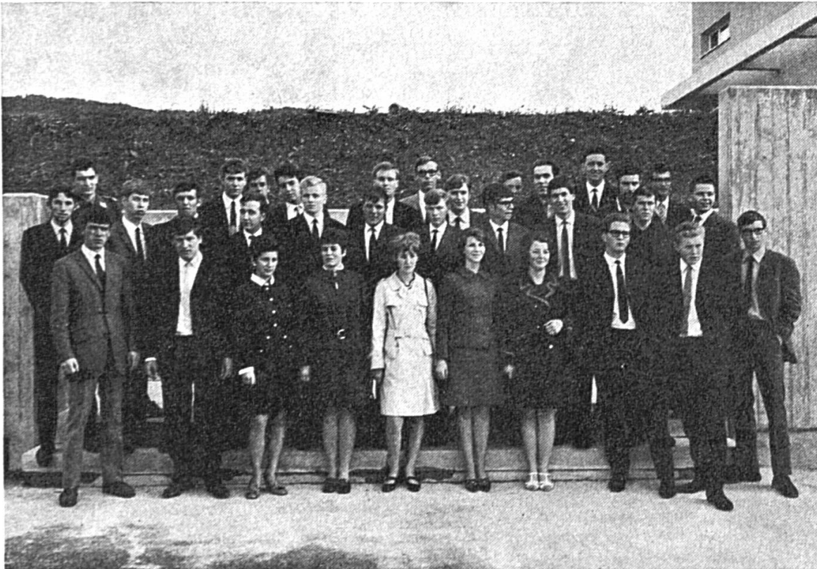
Les 37 apprentis méritants récompensés par l'ADIJ